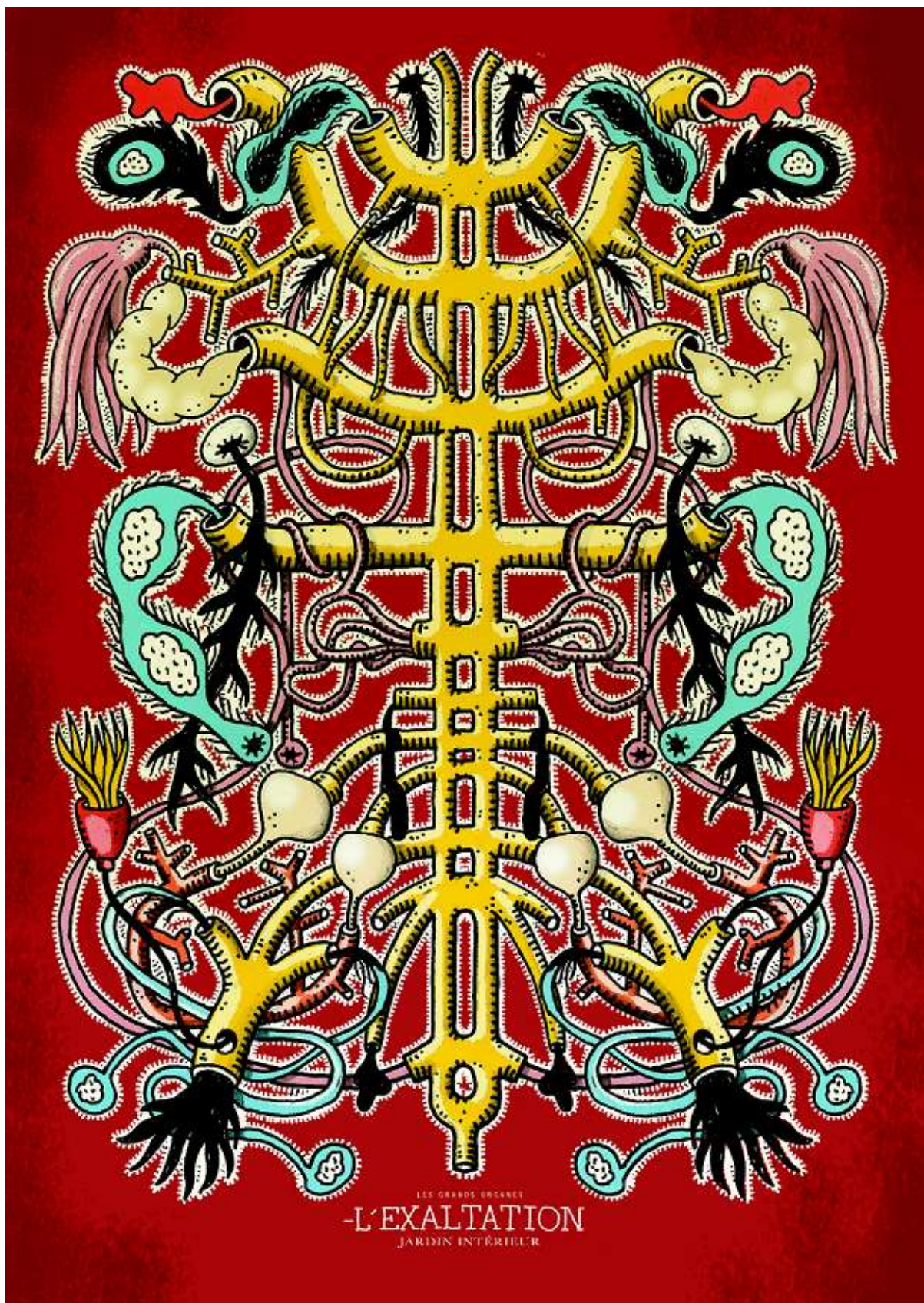
Arboetum, 2014, dessin imprimé sur bâche