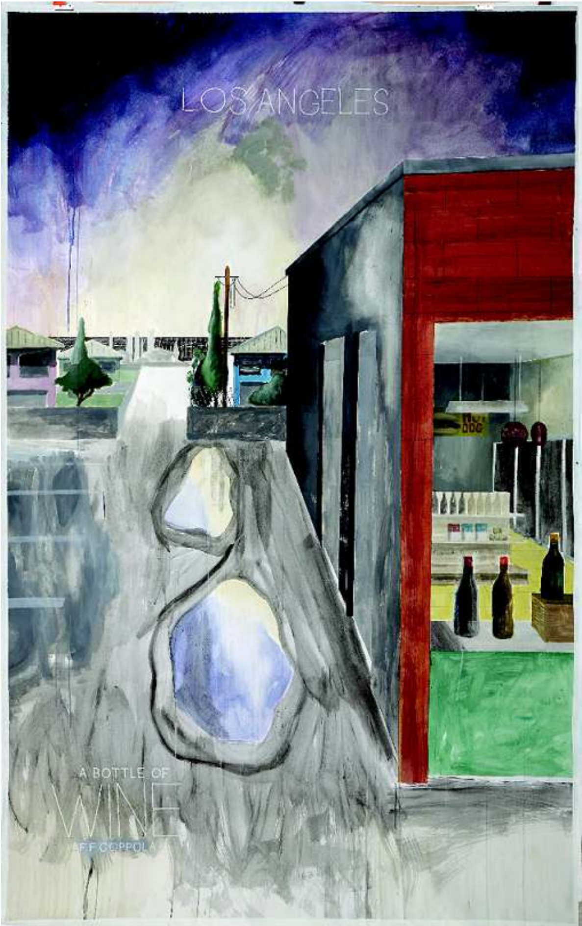
Memory Motel, 2015, aquarelle