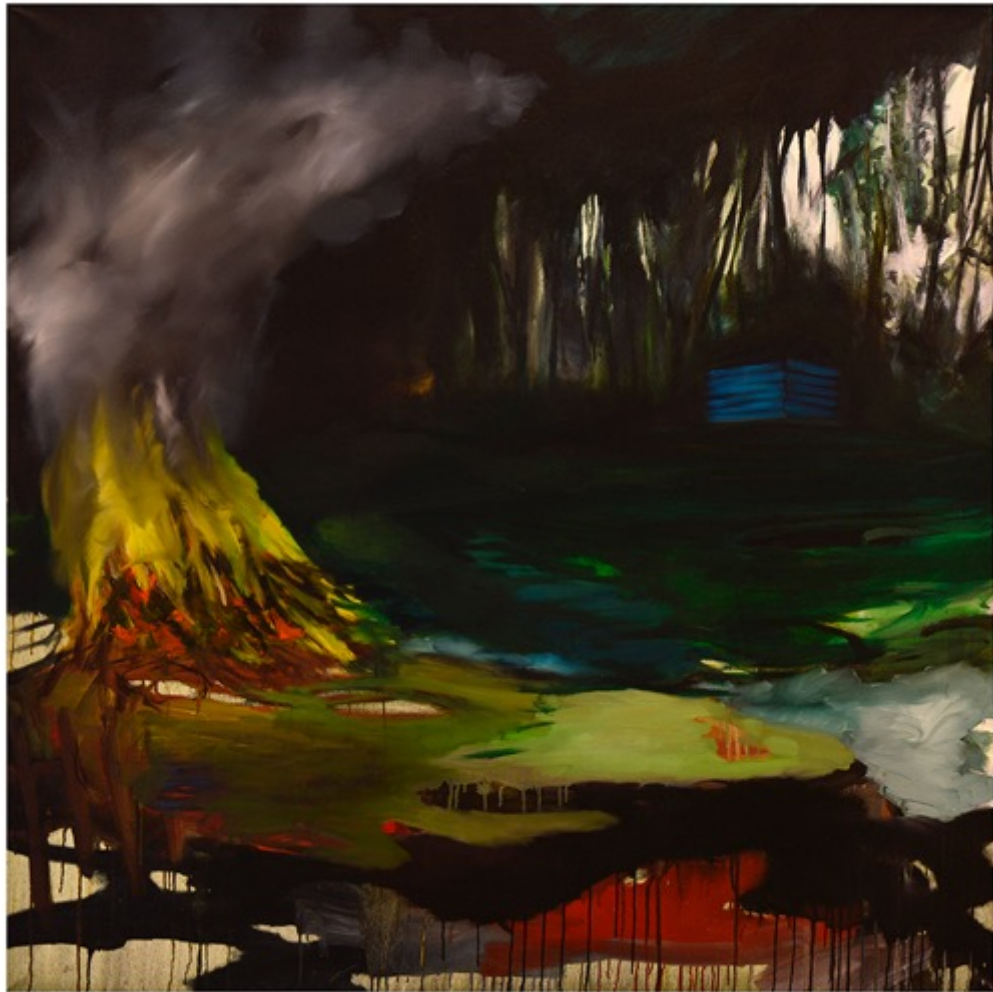
Romain BERNINI Construction n°8, 2007

Huile sur toile 128 x 130 cm