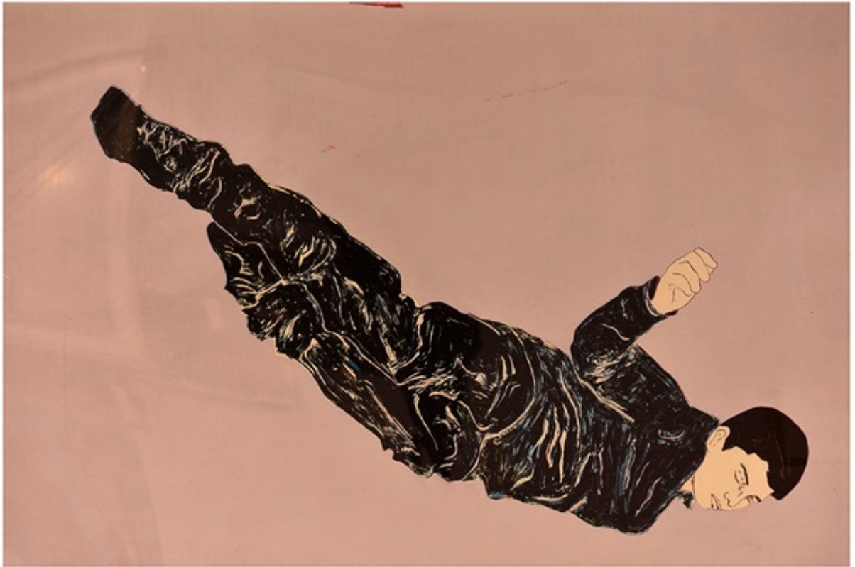
Djamel TATAH Wood0109, 2009

Gravure sur bois et lithographie 124 x 180 cm