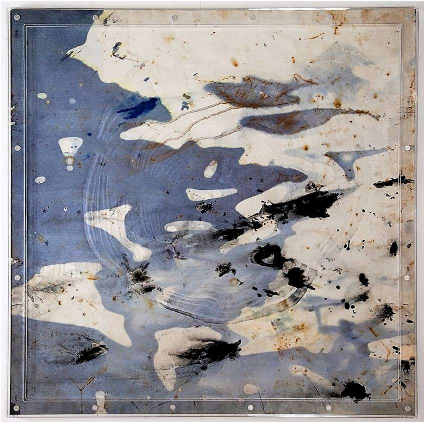
Arbre Cible, 2014 Fluidité colorée Gaufrage, gouache, encre de Chine, plexiglas, 90 x 90 x 2 cm