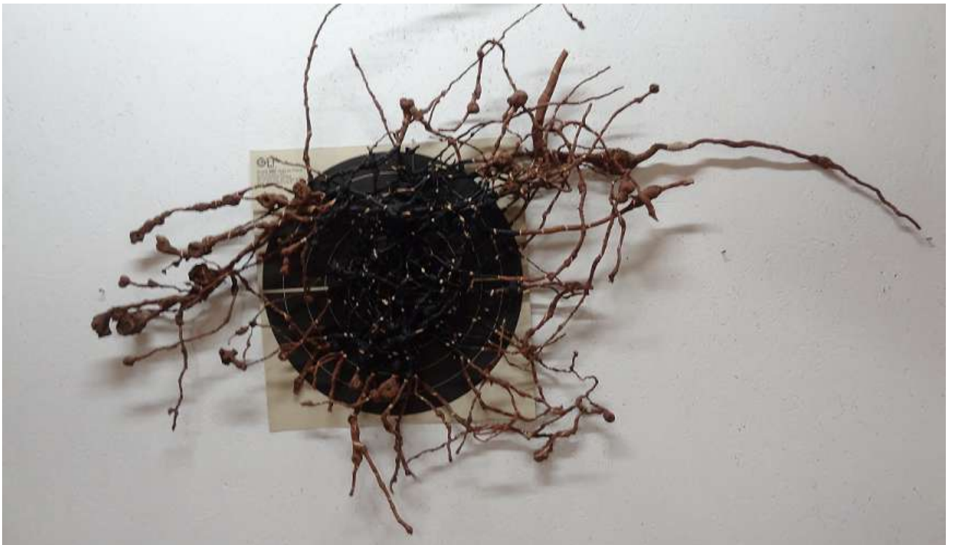
Cible-racine, 2015 cible, racine, acrylique, 80 x 60 cm