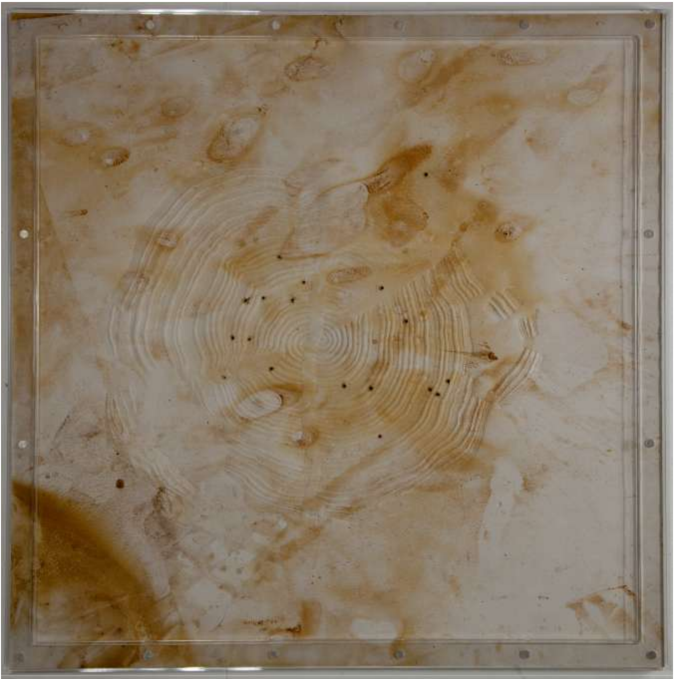
Arbre Cible, 2014 Fluidité colorée Gaufrage, gouache, encre de Chine, plexiglas, 90 x 90 x 2 cm