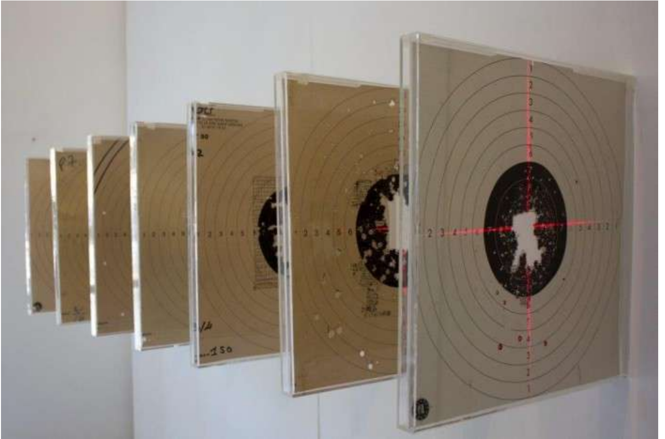
Trajectoire brodée, 2014 Dispositif de cibles, plexiglas, laser, 50 x 120 cm