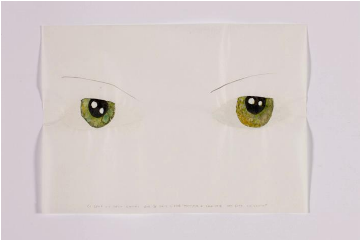
Deux ou deux choses que je sais d'elle, hommage à Sakineh, 2010, aquarelle sur papier 20,5 x 29,5 cm