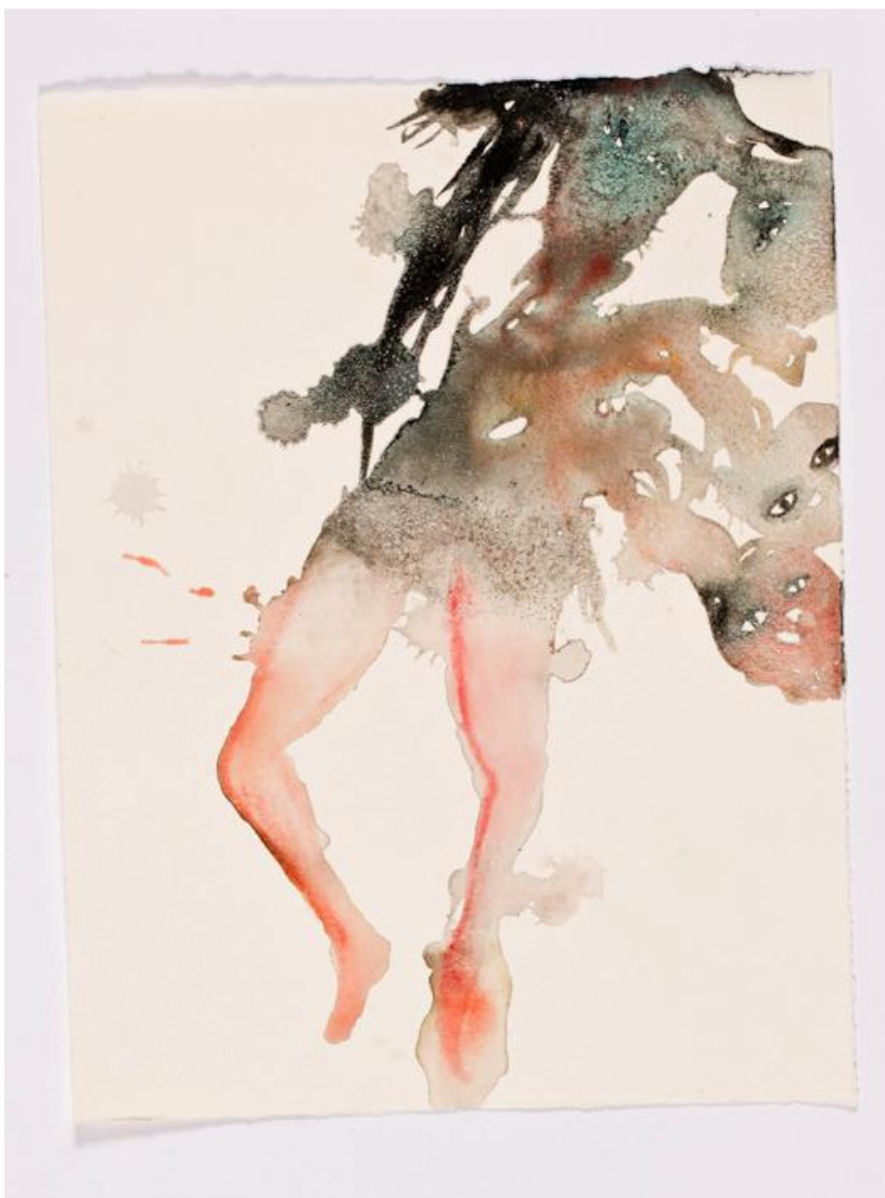
Cortège, 2011, aquarelle, encre et sel sur papier, 33 x 26 cm