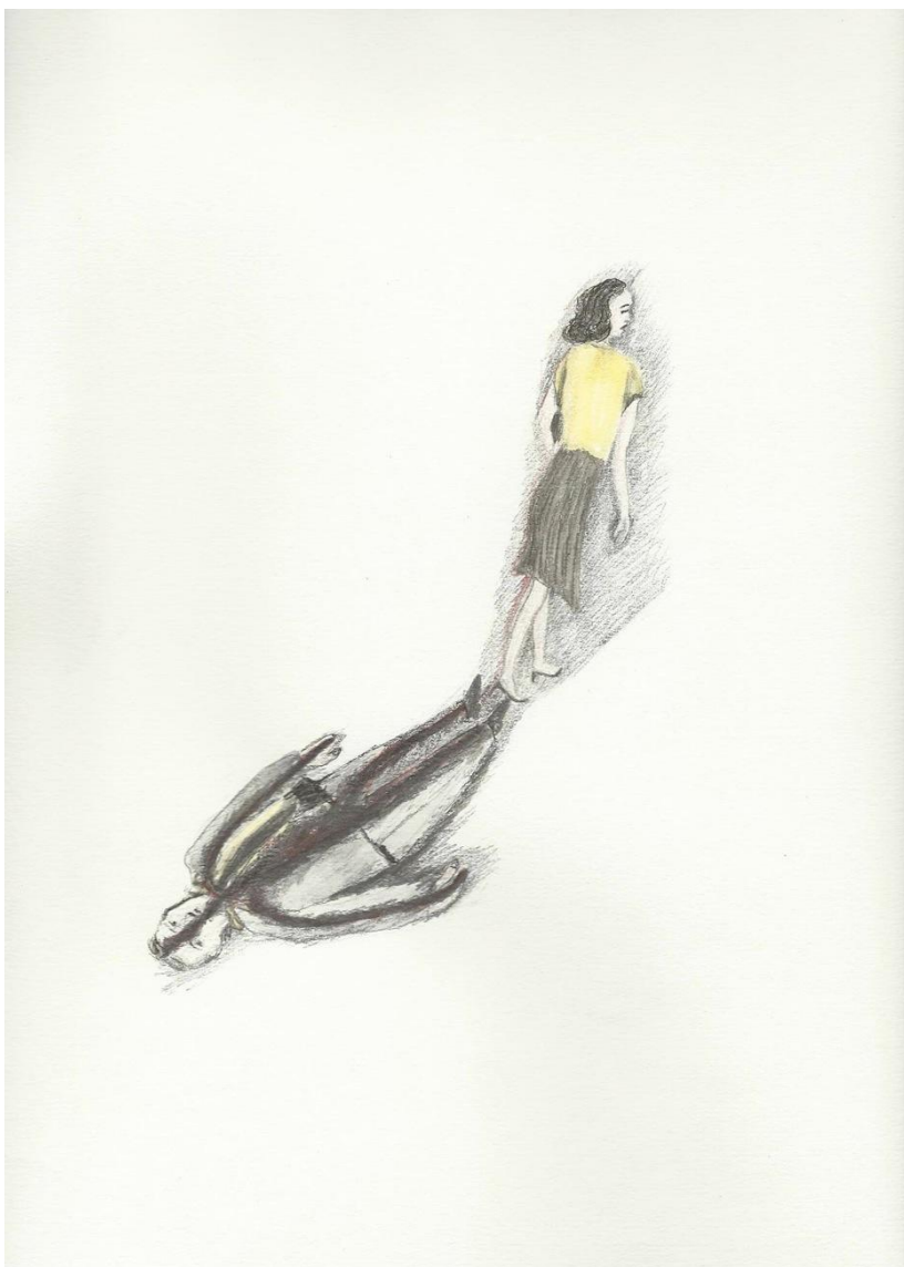
Nymphe 2011, mine de plomb crayon de couleur, encre et encre de chine, 32 x 24