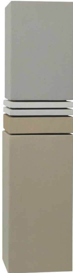
Construction P5C 2014 55 x 11 x 11 cm