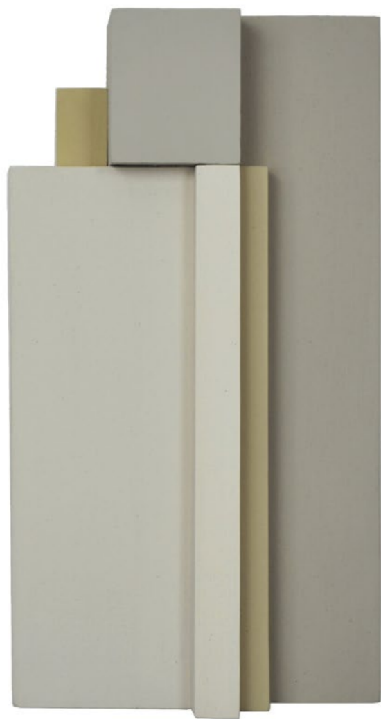
Construction P6A 2013 30,5 x 17 x 8 cm