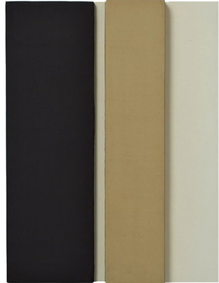
Construction P4B 2014 23,5 x 17,5 x 4,5 cm