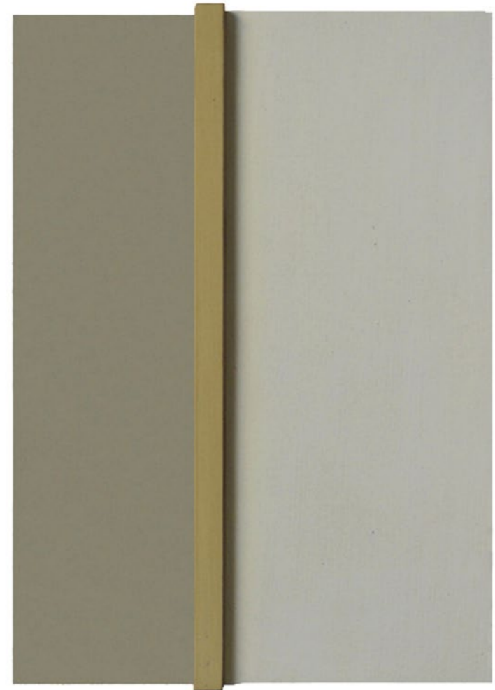
Construction P3A 2014 24 x 19 x 5,5 cm