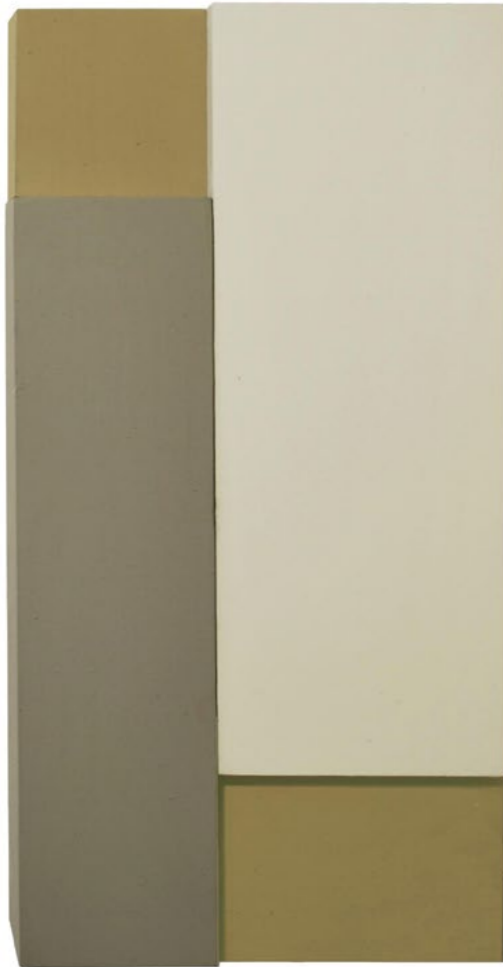
Construction P4L 2014 34 x 16,5 x 6,5 cm

L'œuvre de Jean Charasse s'est toujours signalée par un rapport à la structure, même si, paradoxalement, dans ses débuts figuratifs, cette structure pouvait être dissimulée, codée, dans — comme leur nom l'indique — des structures élémentaires de la parenté, à l'occidentale.