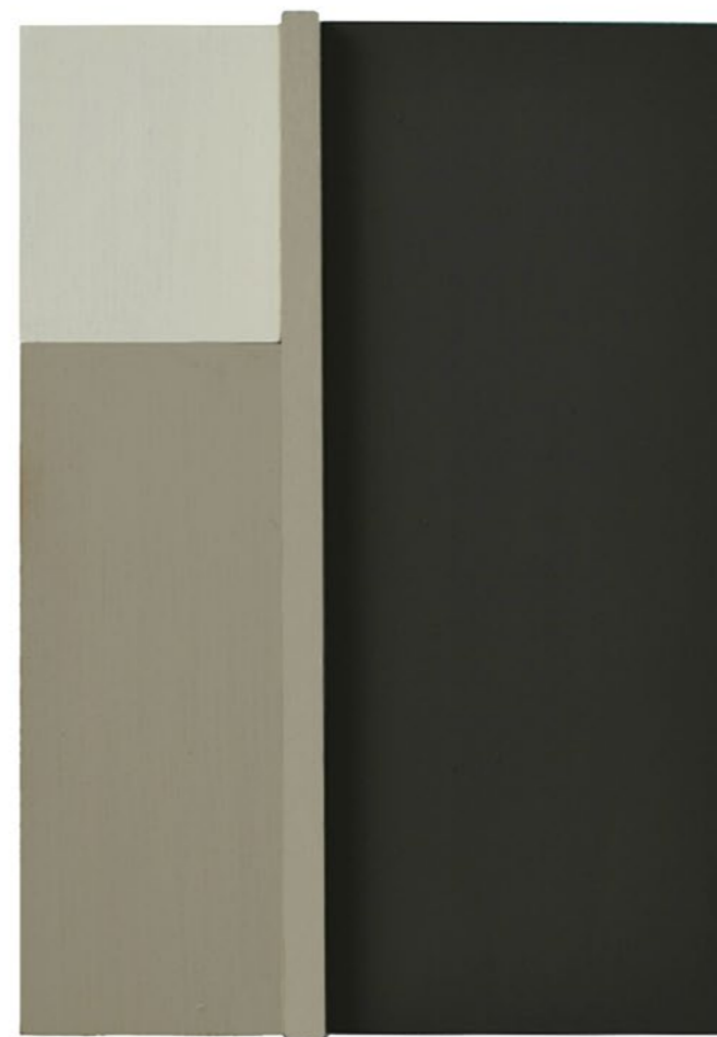
Construction P4H 2014 24 x 17 x 5,5 cm