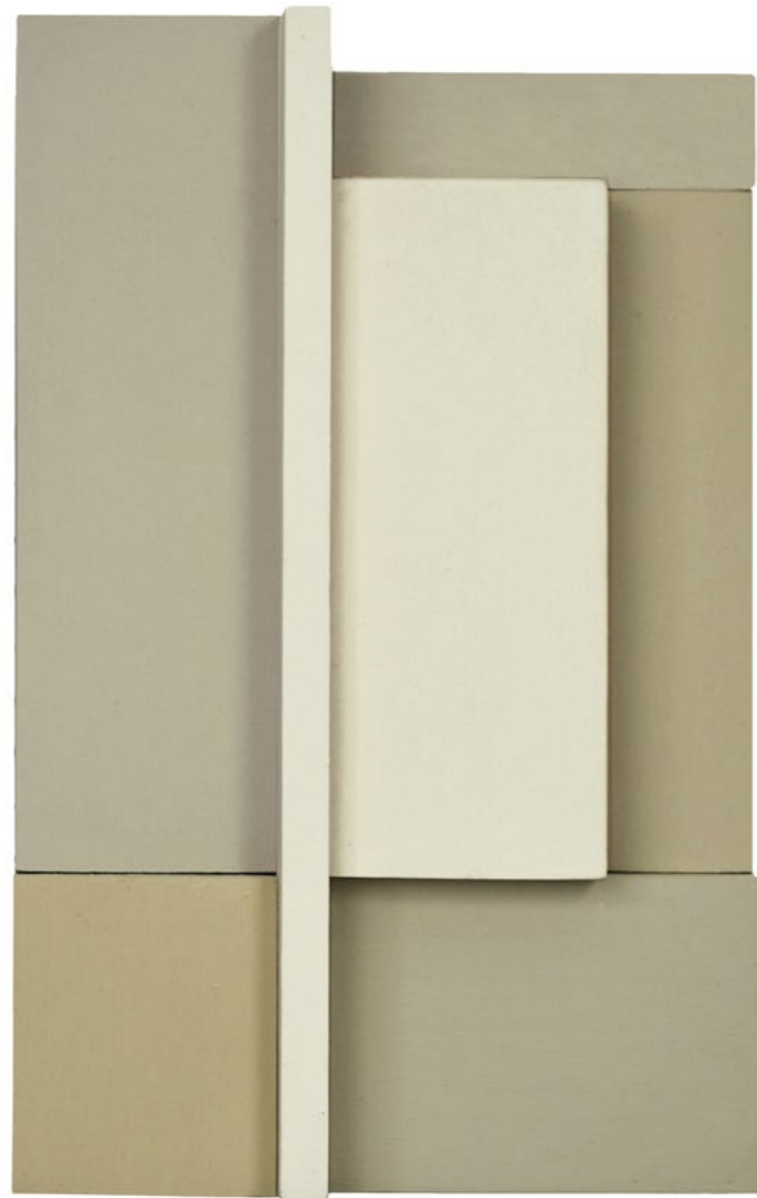
Construction P7C 2013 23,5 x 15 x 6 cm