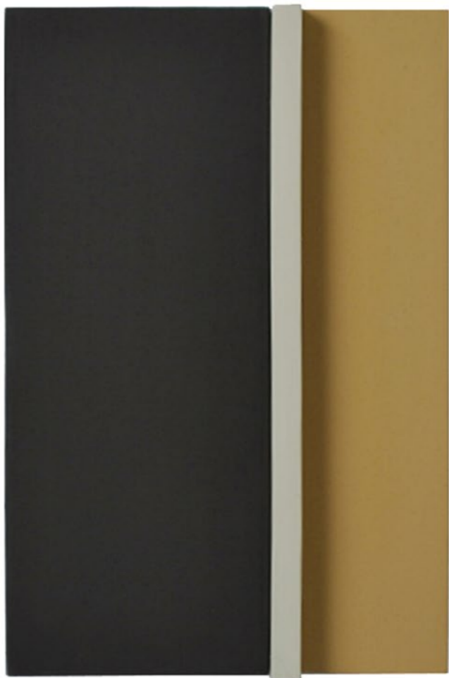
Construction P3C 2014 24 x 15 x 6,5 cm