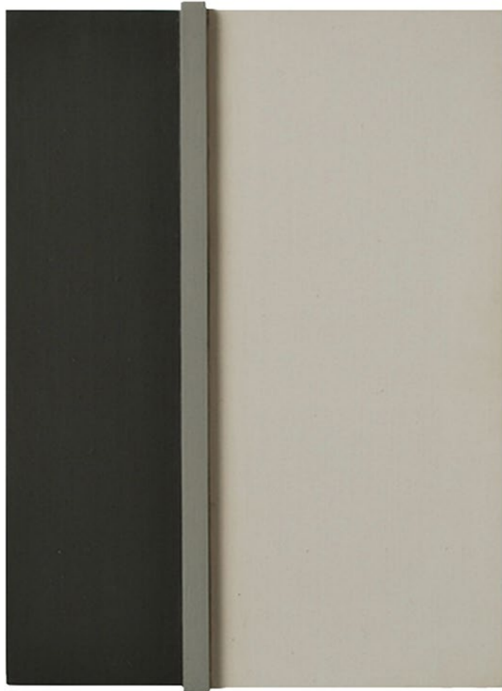
Construction P3B 2014 24,5 x 18 x 5,5 cm