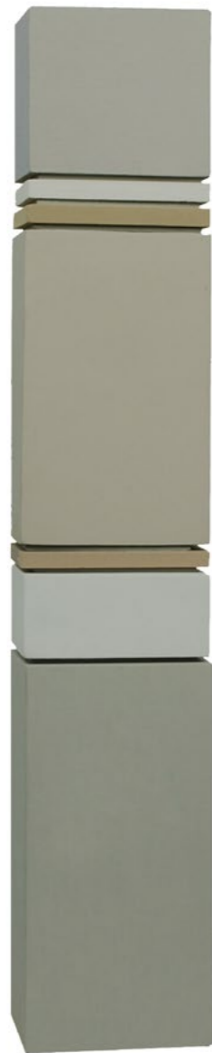
Construction P7B 2014 46,5 x 8 x 7 cm