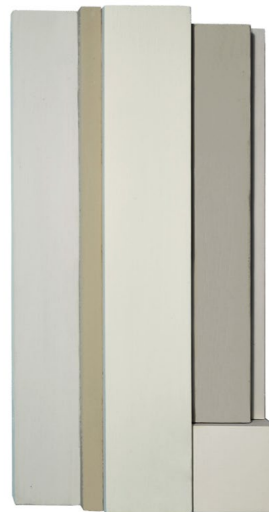
Construction P6B 2013 33 x 17,5 x 6,5 cm