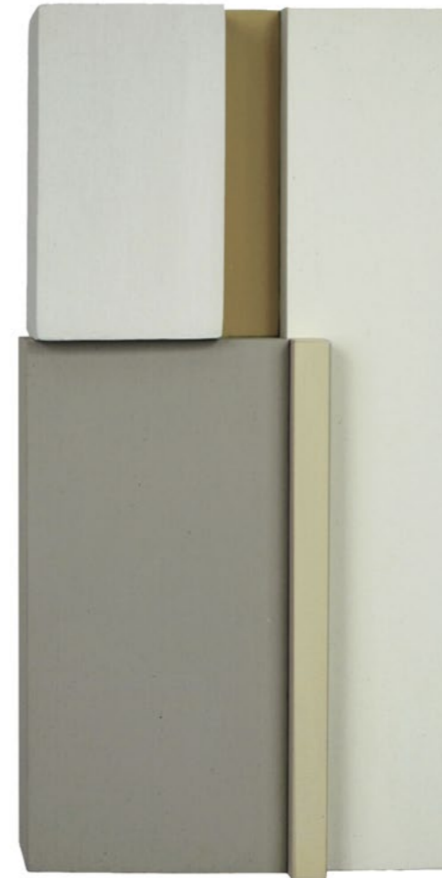
Construction P5A 2013 30,5 x 17 x 7,5 cm