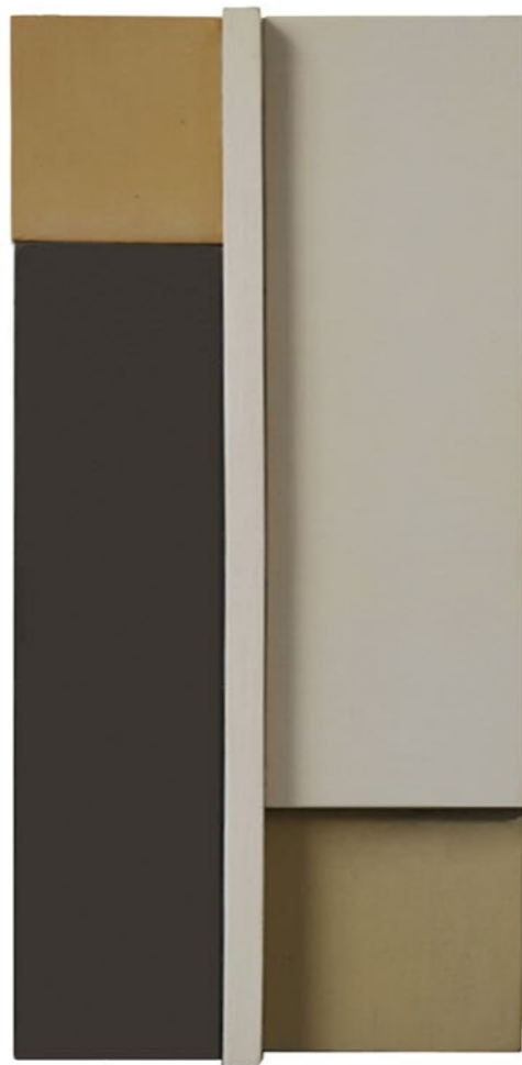
Construction P5A 2014 30 x 13 x 5,5 cm