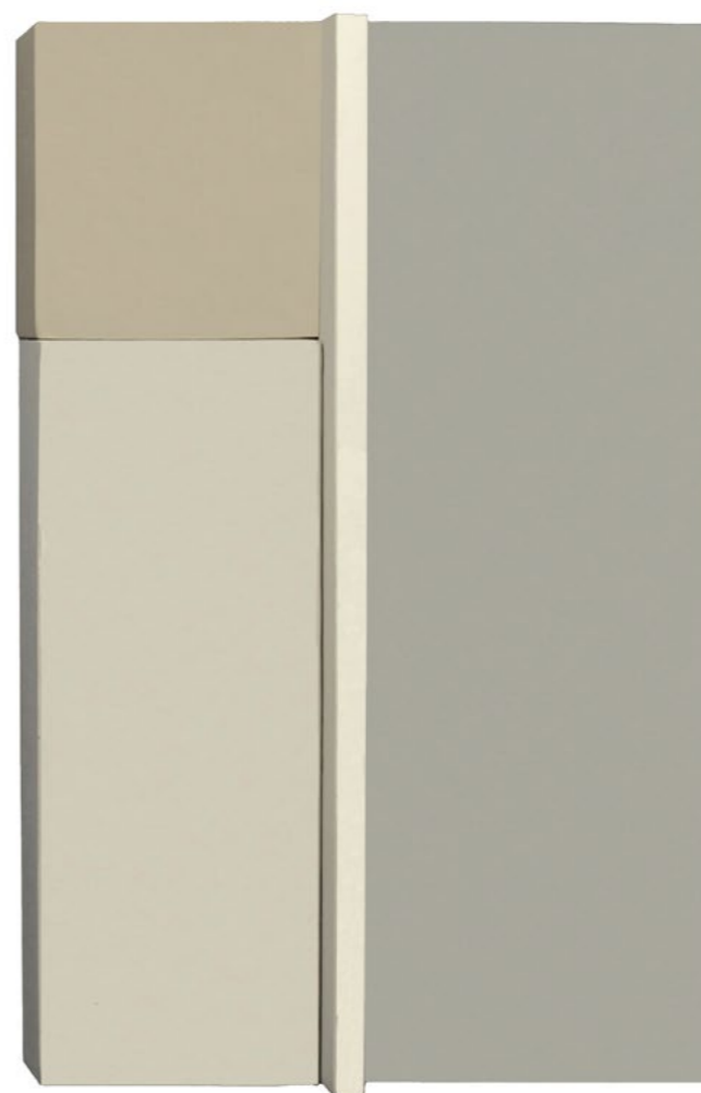
Construction P4J 2014 32,5 x 21 x 7,5 cm