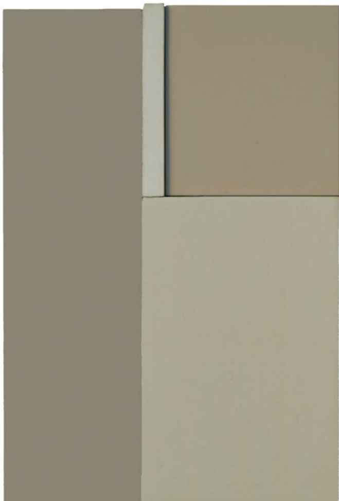
Construction P4I 2014 26 x 17,5 x 4,5 cm