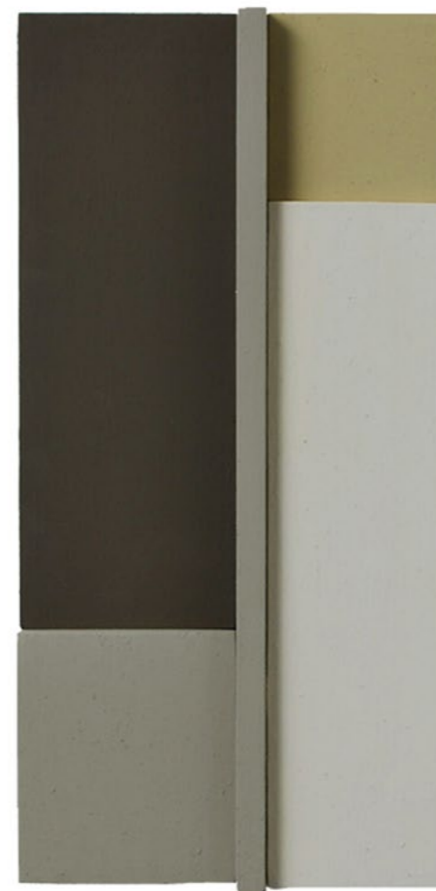
Construction P5B 2014 26,5 x 13,5 x 6,5 cm