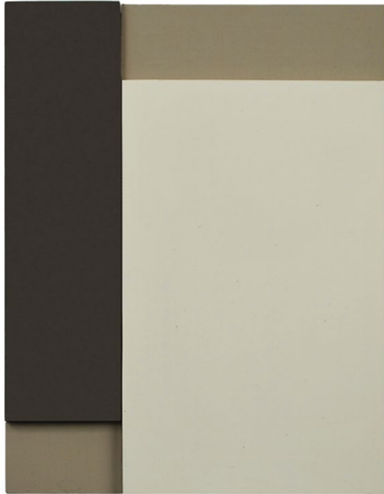
Construction P4E 2014 30,5 x 23,5 x 5,5 cm