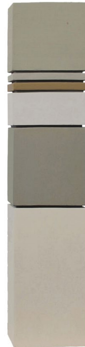
Construction P6B 2014 45 x 9,5 x 6 cm