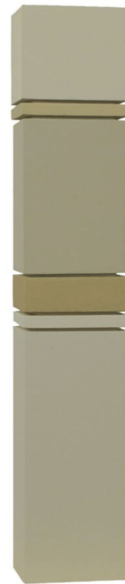
Construction P6A 2014 46,5 x 8 x 7 cm