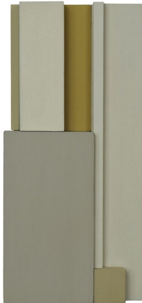
Construction P7D 2013 33 x 16 x 6,5 cm