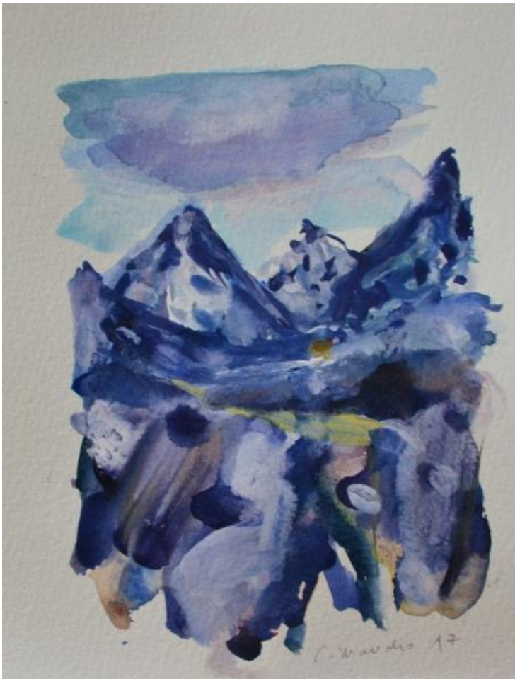
Sans titre, aquarelle et gouache sur papier, 19.7x14,7 cm