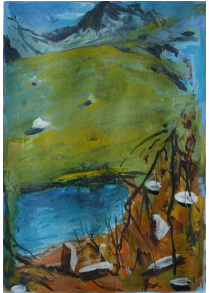
sans titre, 2016, acrylique sur papier, 38x28 cm