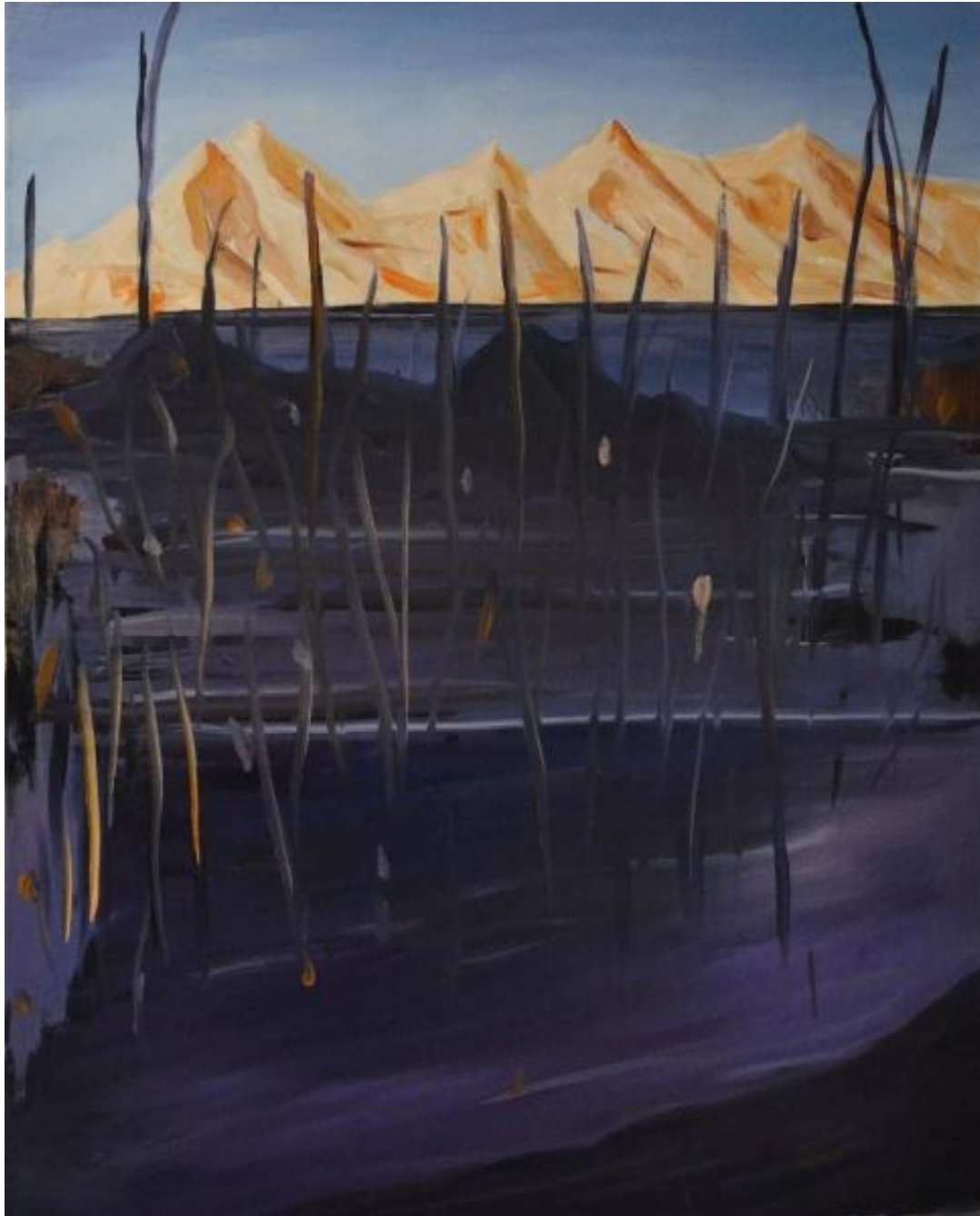
Sans titre, huile sur toile, 81 x 65 cm