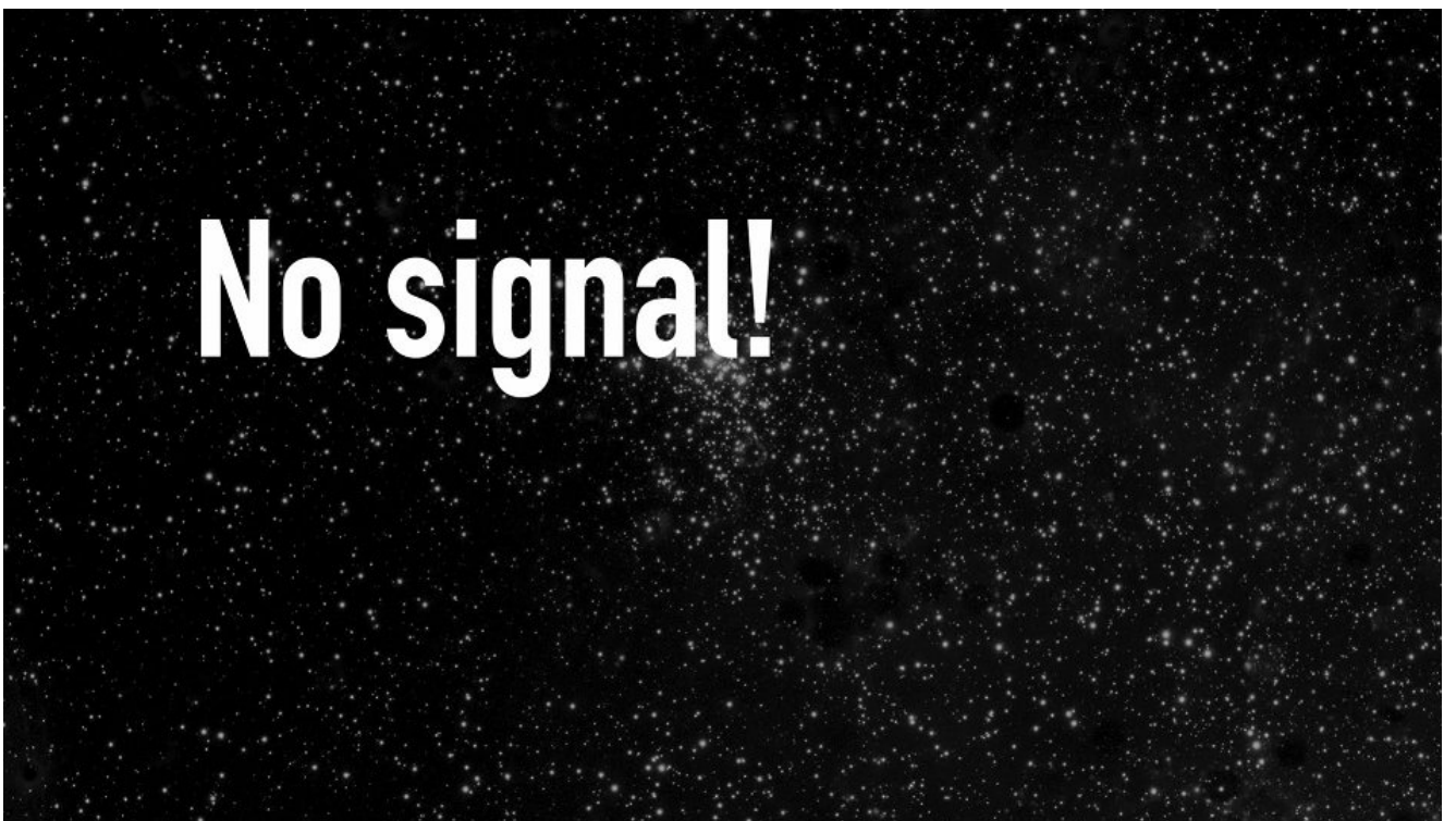
Laurent Mulet, Dreamscreen , 2017, Photogramme / Vidéo HD durée 2', diffusion en boucle