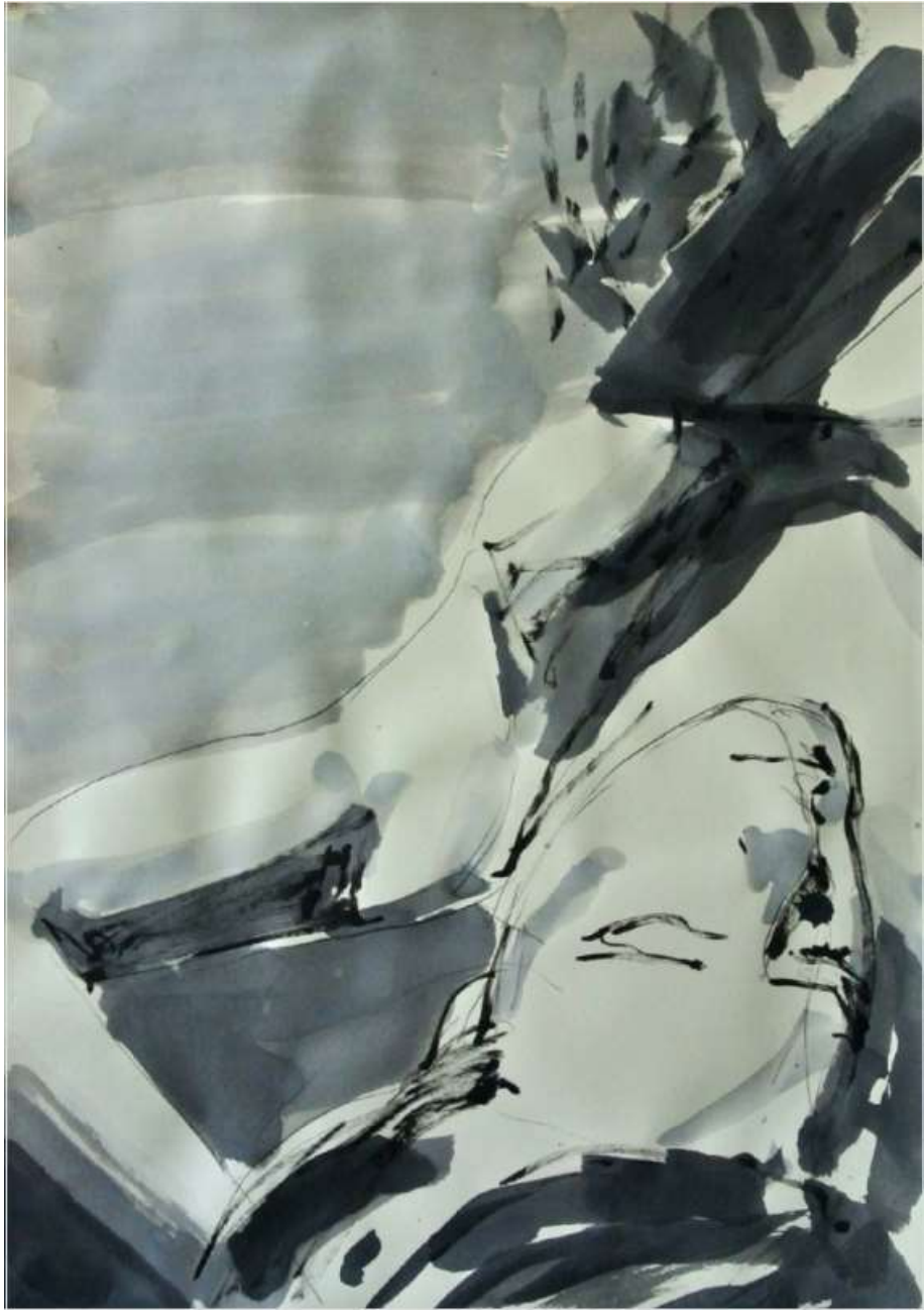
Sans titre , 2016, encre de chine