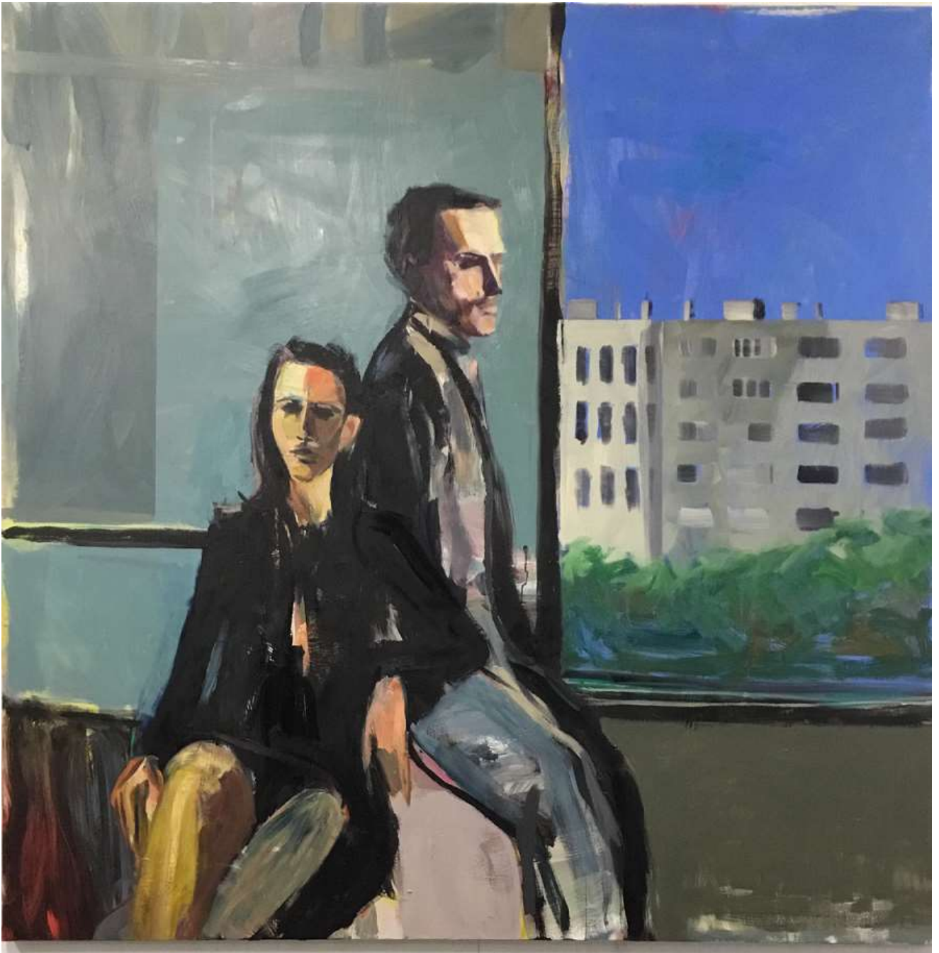
Sans titre , 2016, huile sur lin, 200 x 200 cm