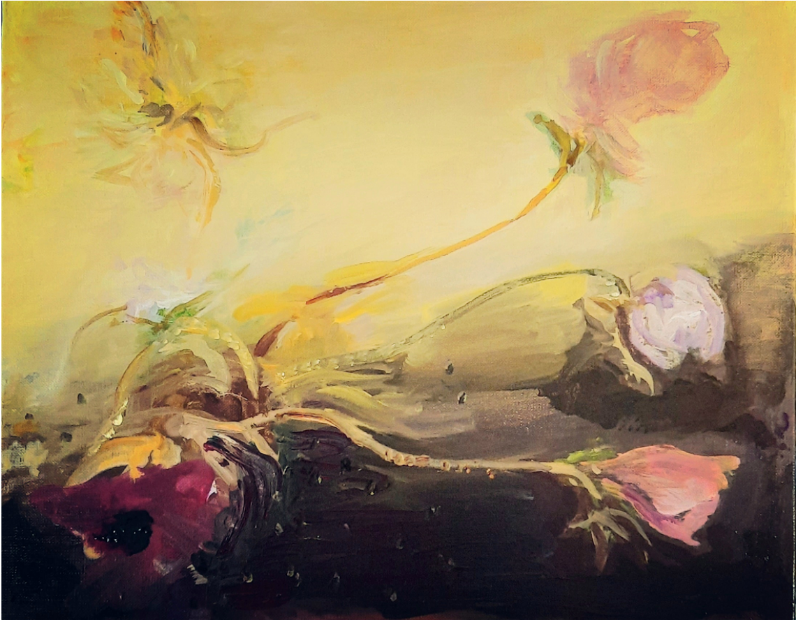
Sans titre 2023. Acrylique sur toile. 33x41cm