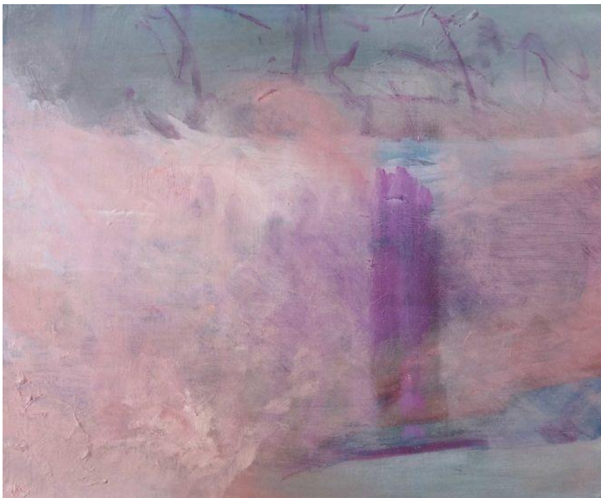
Le reste du vitrail, 2019, huile sur toile, 33 x 41 cm