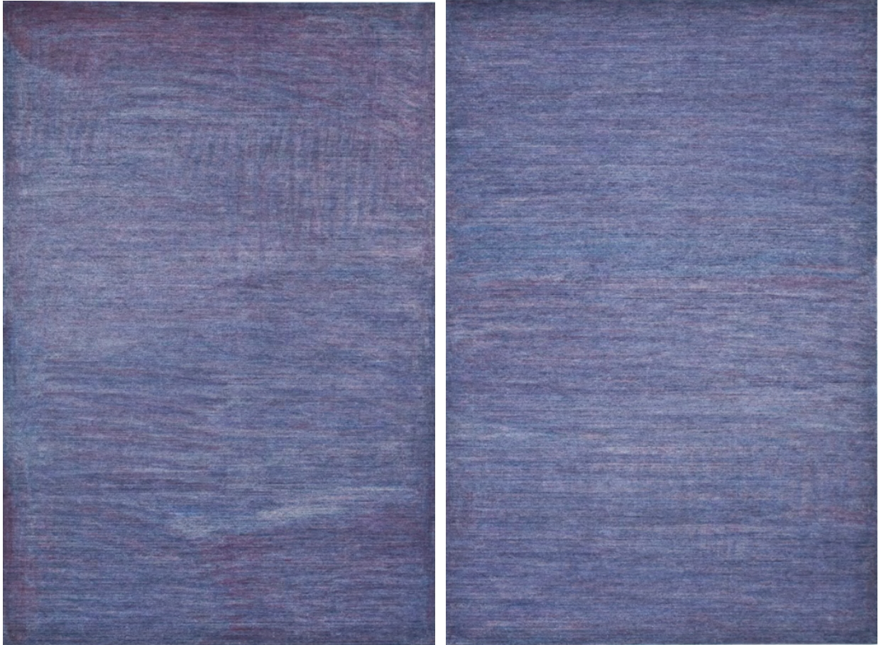
Nuance 96 (diptyque), 2013, 120 x 80 cm chaque, pastel à l'huile contrecollé sur Dibond