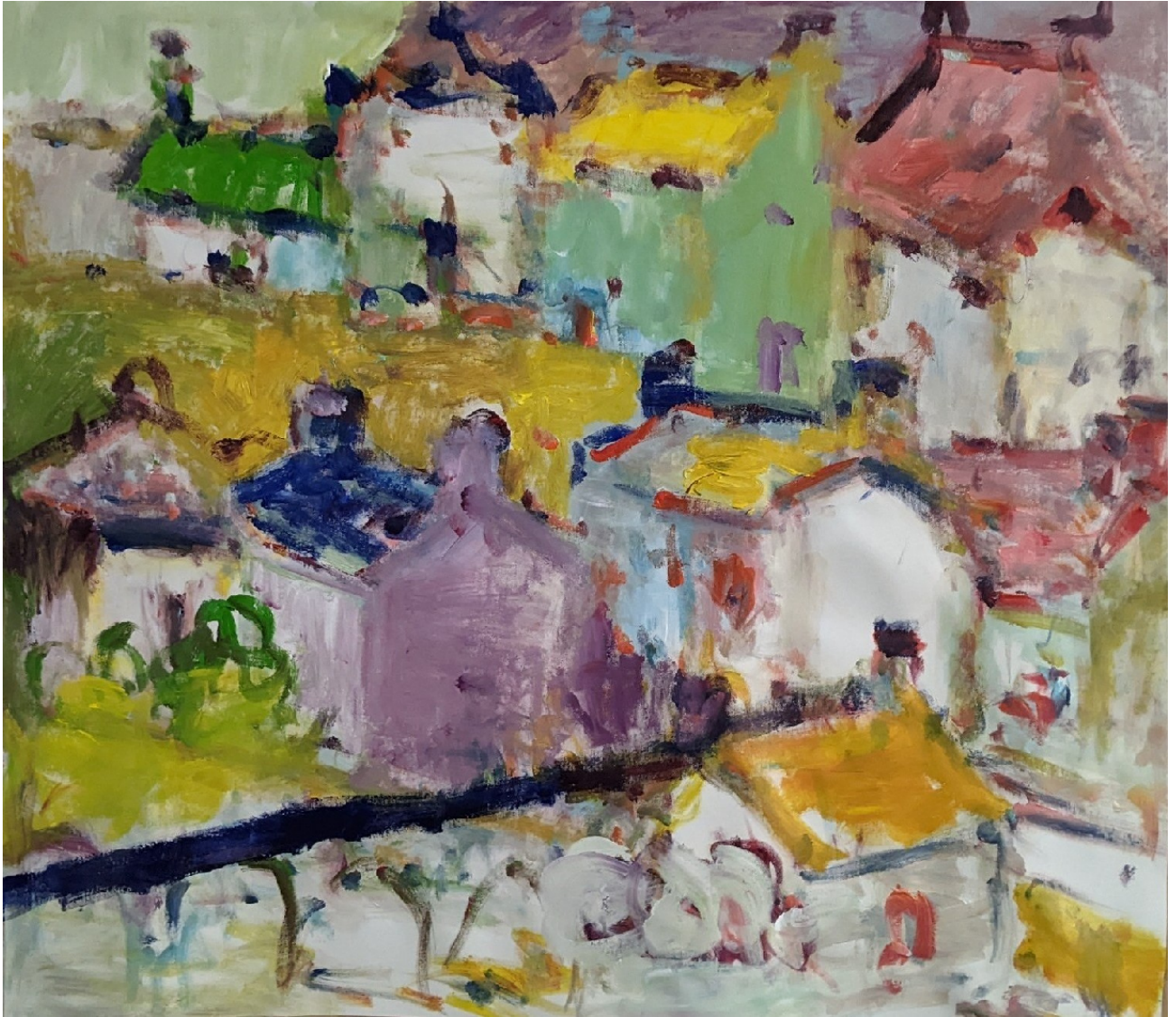
Acrylique sur toile, 2022, 100 x 100 cm