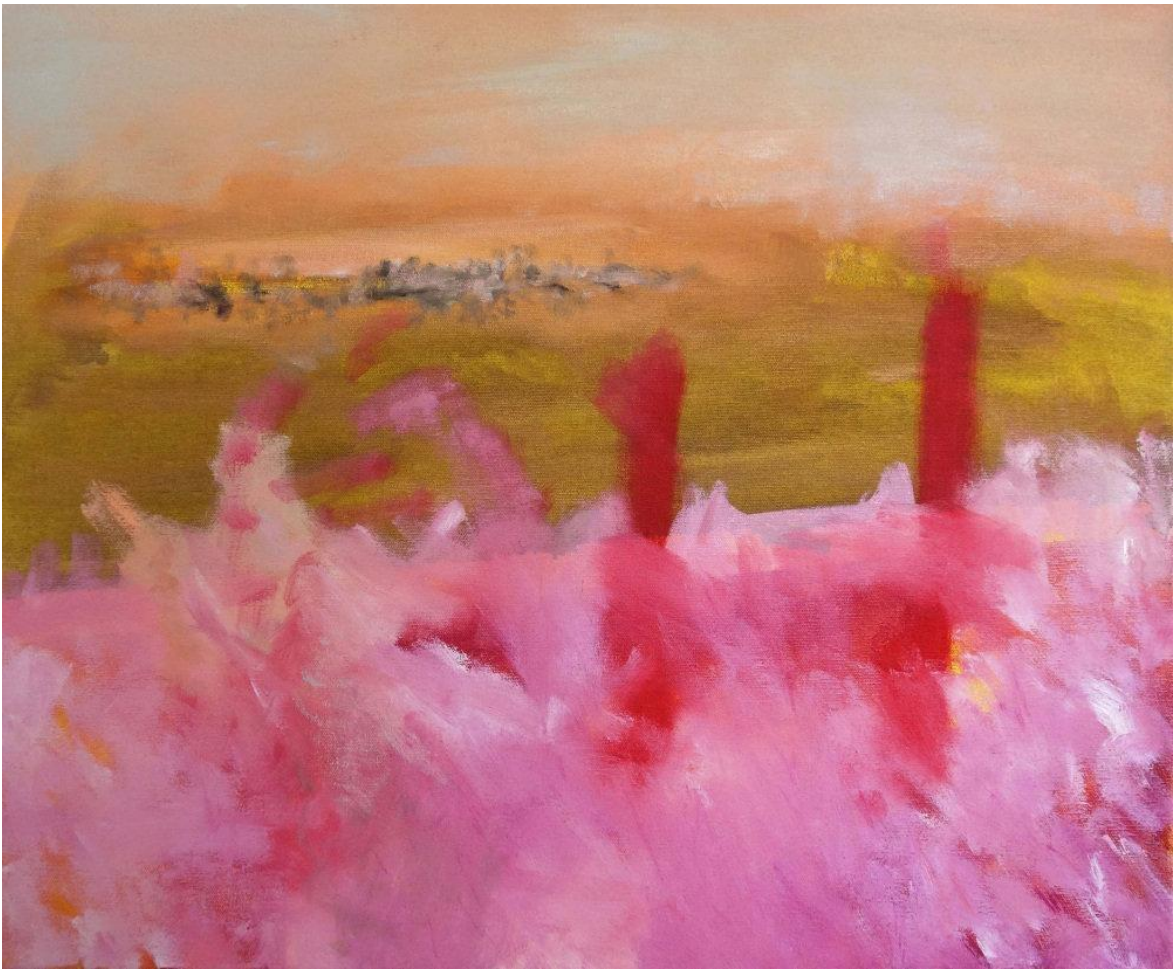
Ou le soleil, 2021, huile sur toile, 50 x 60 cm