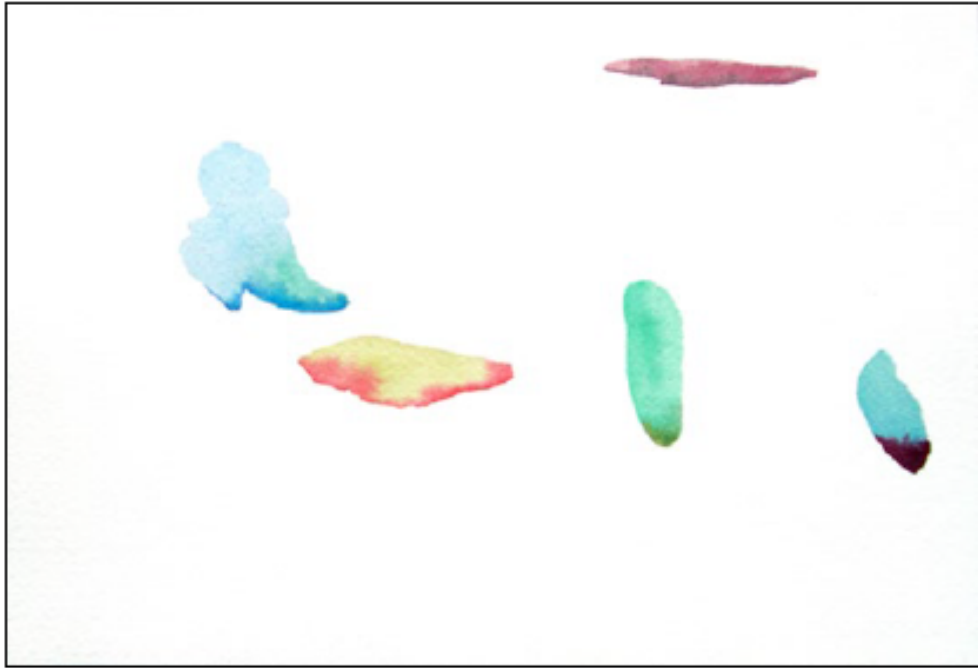
Sans titre, 2021, aquarelle sur papier, 18 x 26 cm