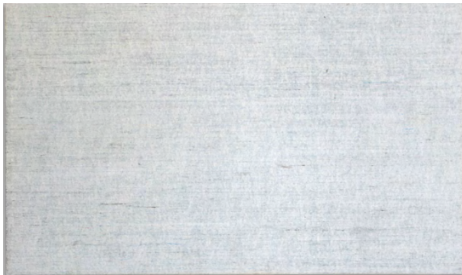
Nuance constable 011, 2018, 48,3 x 28,6 cm, pastel à l'huile contrecollé sur Dibond