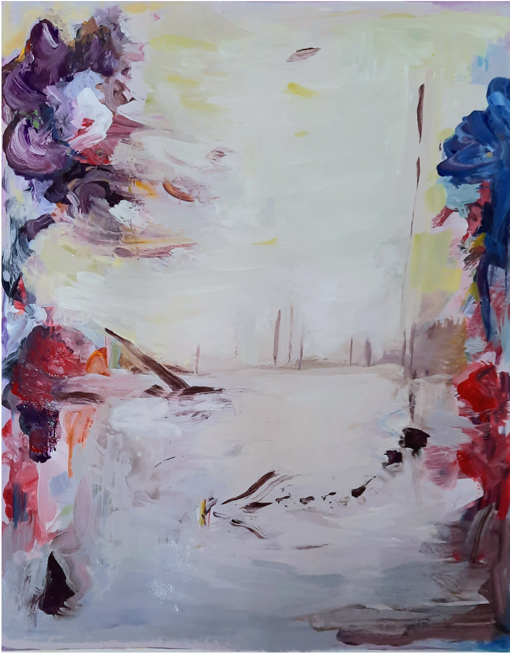
Apparition d'un paysage, 2023, acrylique sur papier 45 x 39 cm