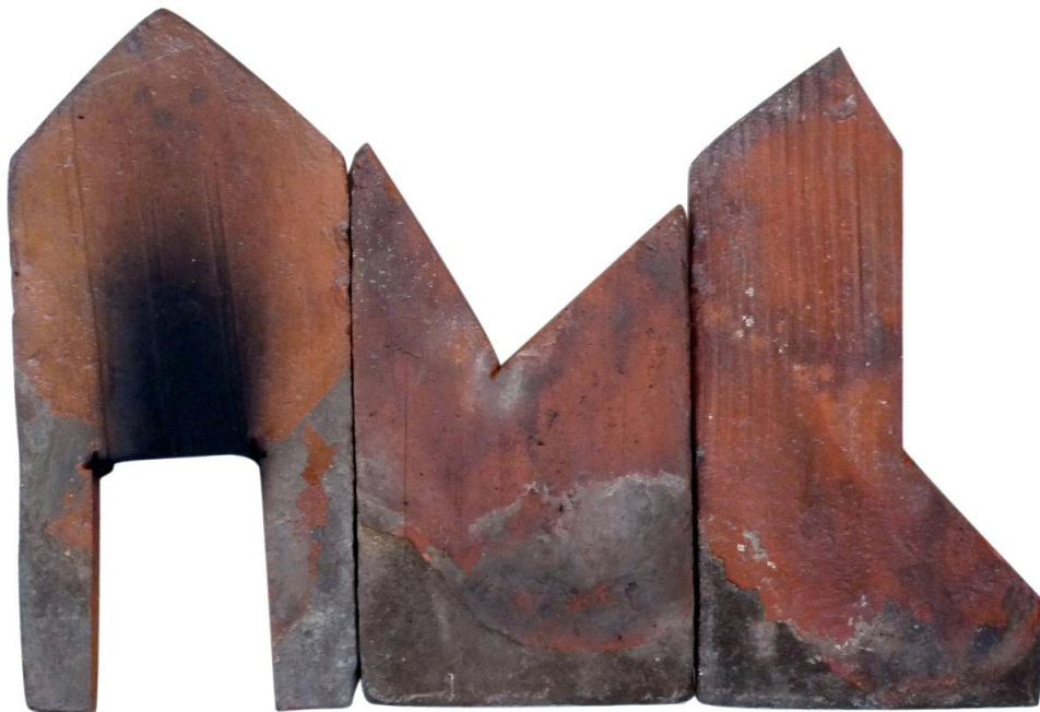
Ni toi-t-ni moi