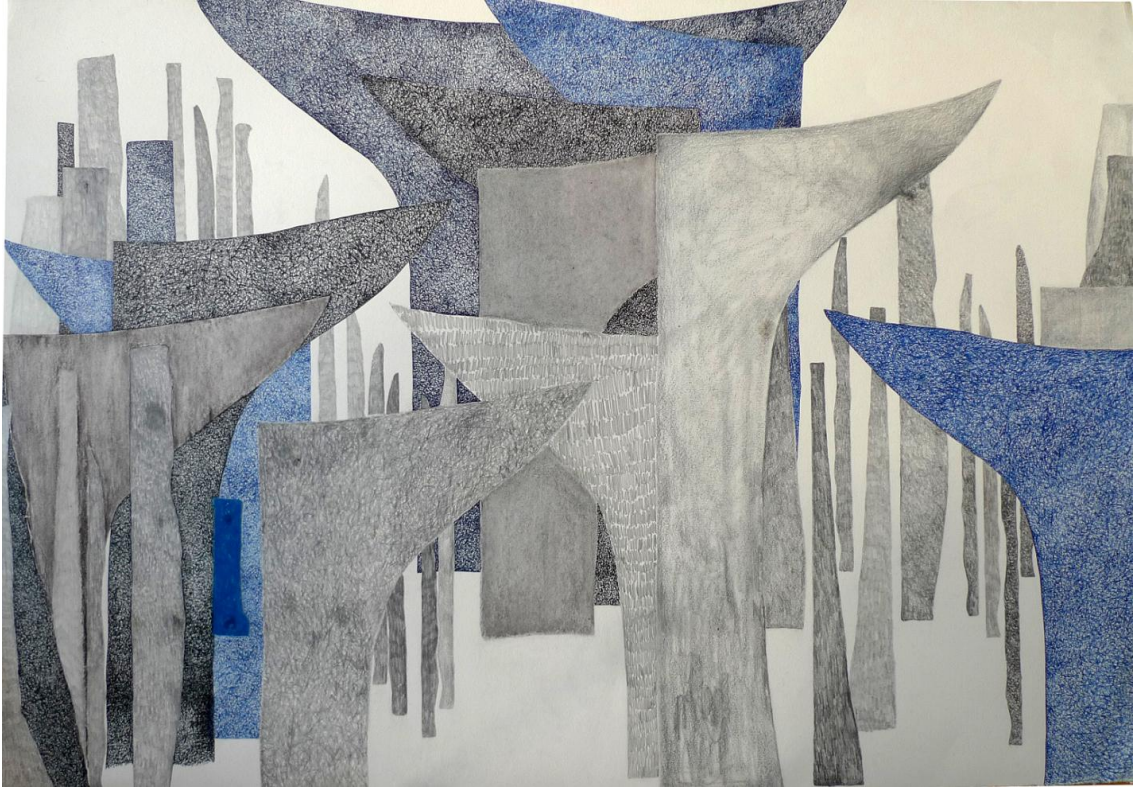
Alphabet des motifs