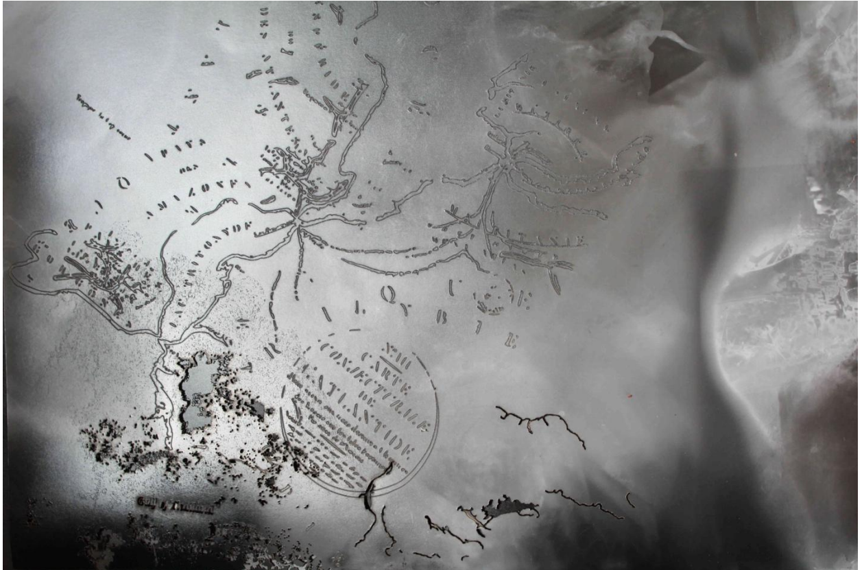
Abzû , 2021-2022 gravure et découpe numériques, poudre graphite et grattage sur tirages argentiques 50,8 x 61 cm chacun