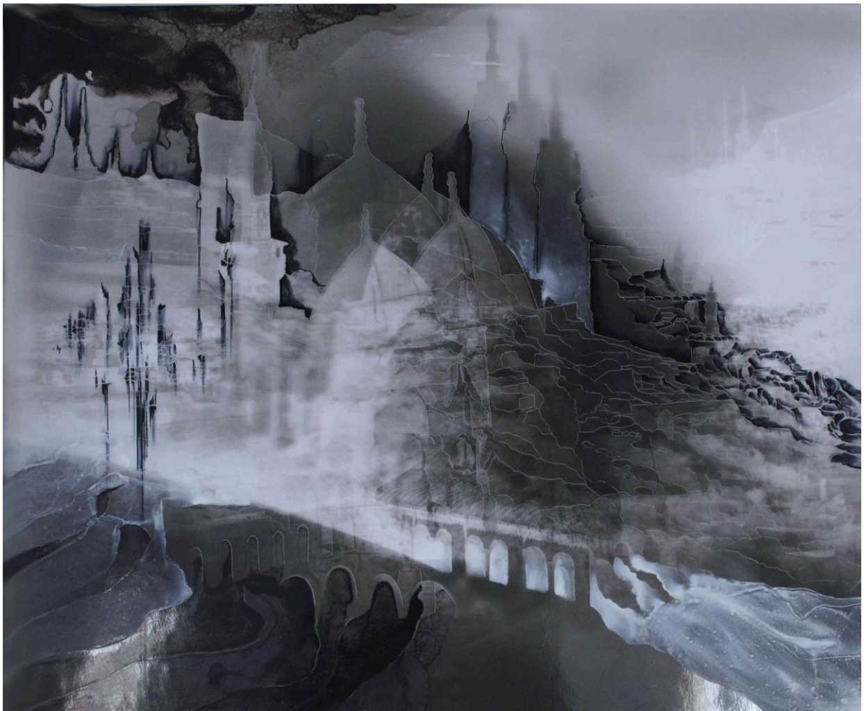
Creuser l'image, 2021 série de tirages argentiques dessinés et gravés 50,8 x 61 cm