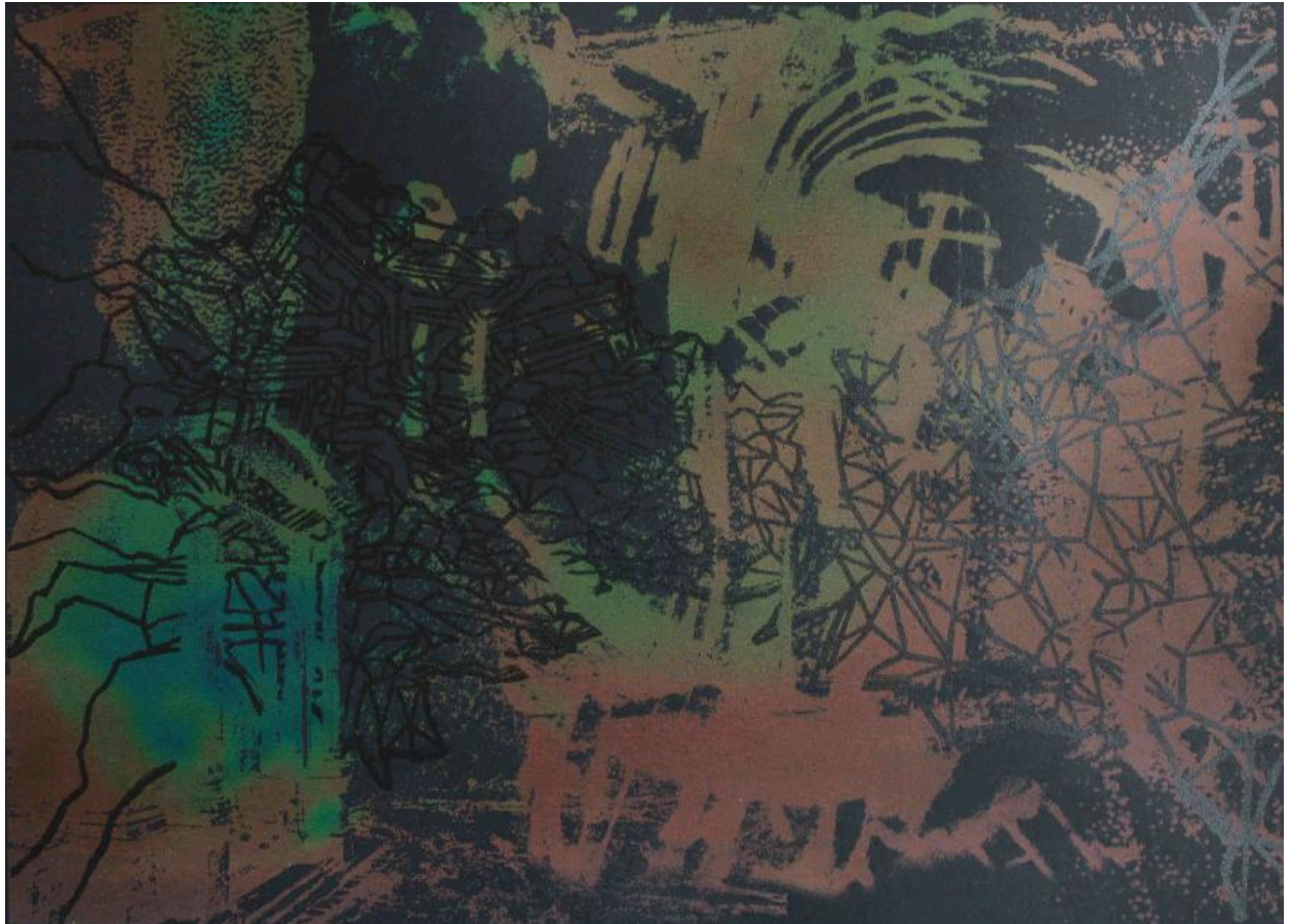
Strates thermiques , 2019 ensemble de sérigraphies thermosensibles, 30 x 42 cm