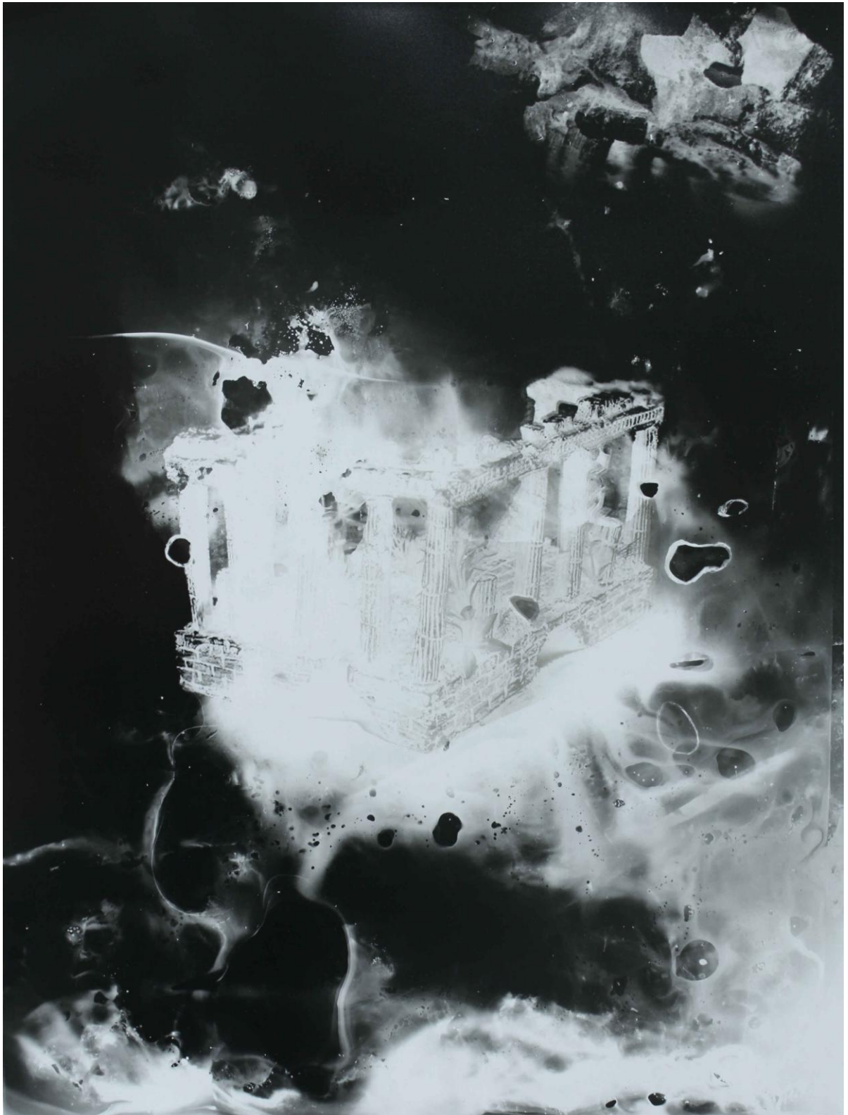
Submergées (ruines d'aquarium) , 2020-2022 série photographique, tirages argentiques par contact 30 x 40 cm