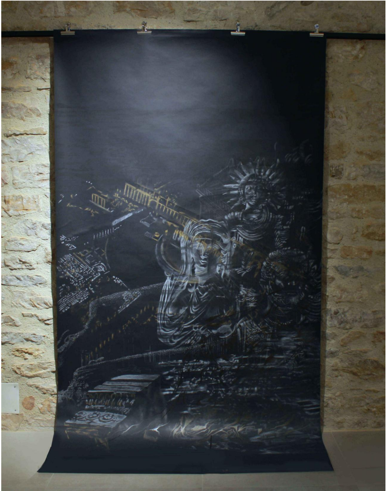
Révéler l'absence , 2018-2020 série de 4 dessins, techniques mixtes sur papier pastel sec, fusain, encre, poudre graphite