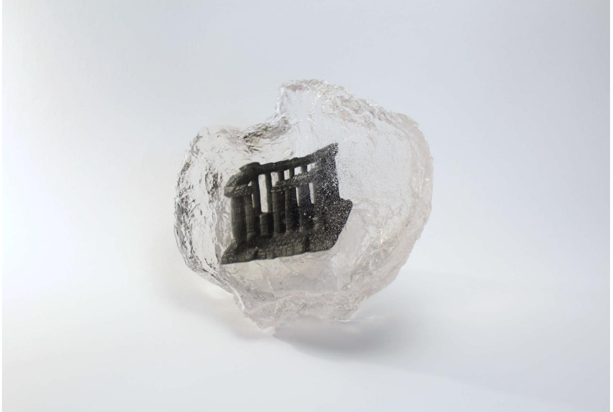
Captures fossiles, 2020-2022 série d'objets photographiques (inclusions photographiques, résine époxy) dimensions variables