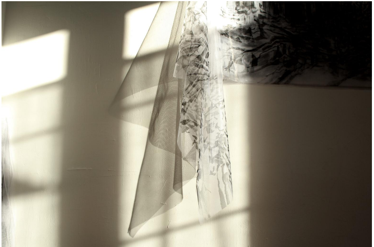
A travers , 2022 création en cours