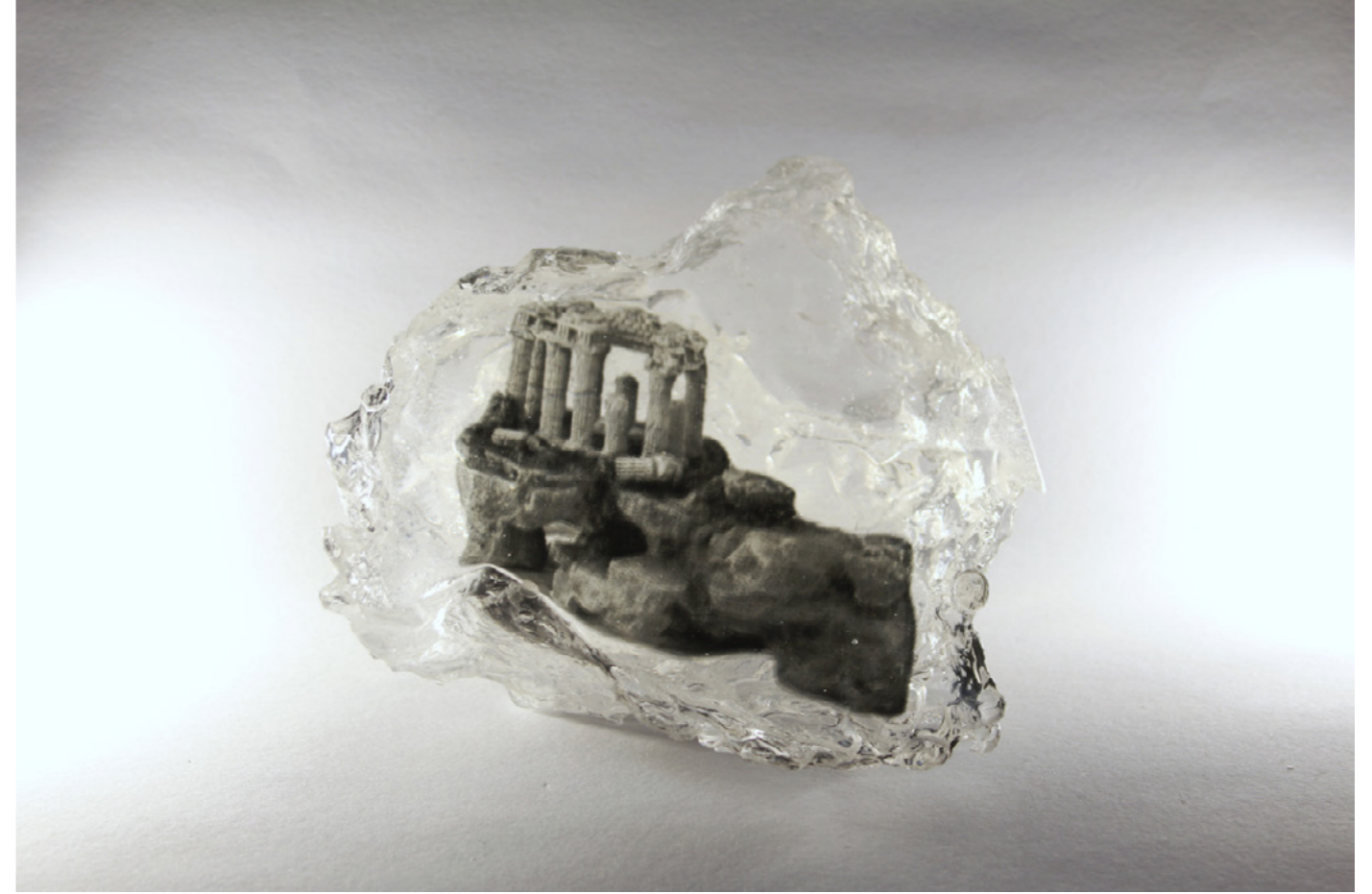
Guénaëlle de Carbonnières, série Captures fossiles, 2020-22 Temple perché résine époxy et négatif photographique pièce unique dans une édition de 3 - 13 x 13 x 7 cm