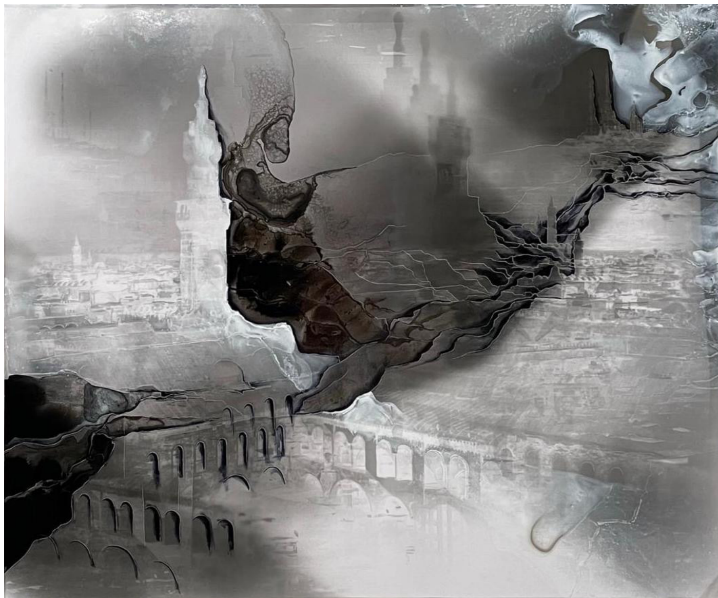
Guénaëlle de Carbonnières, série Creuser l'image, 2020-22