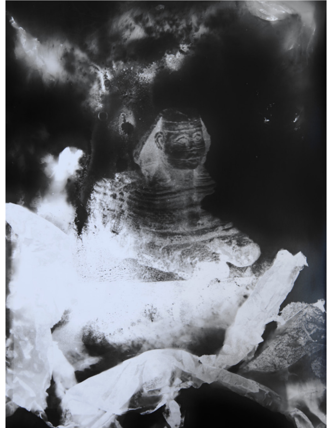
Guénaëlle de Carbonnières, série Submergées (ruines d'aquarium), 2020-22 Sphinx tirage argentique par contact sur papier RC encadrement en métal blanc, verre antireflet tirage unique dans une édition de 3 - 40 x 30 cm