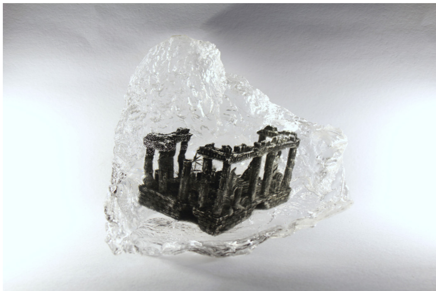
Guénaëlle de Carbonnières, série Captures fossiles, 2020-22