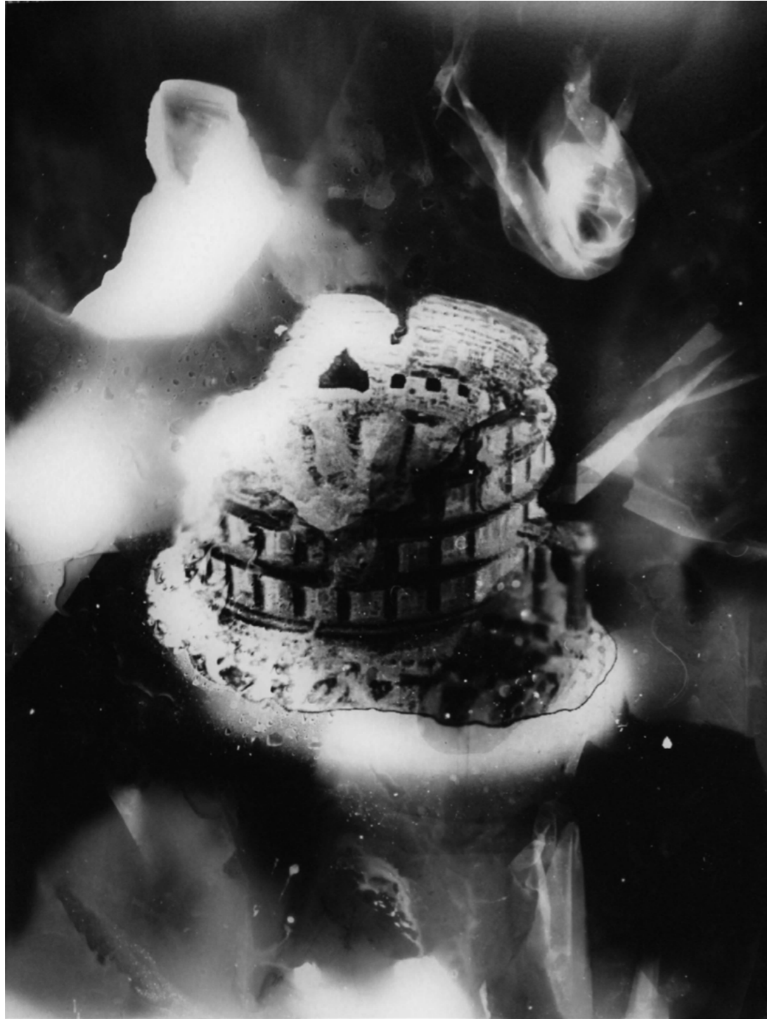
Guénaëlle de Carbonnières, série Submergées (ruines d'aquarium), 2020-22 Colisée tirage argentique par contact sur papier RC encadrement en métal blanc, verre antireflet tirage unique dans une édition de 3 - 40 x 30 cm