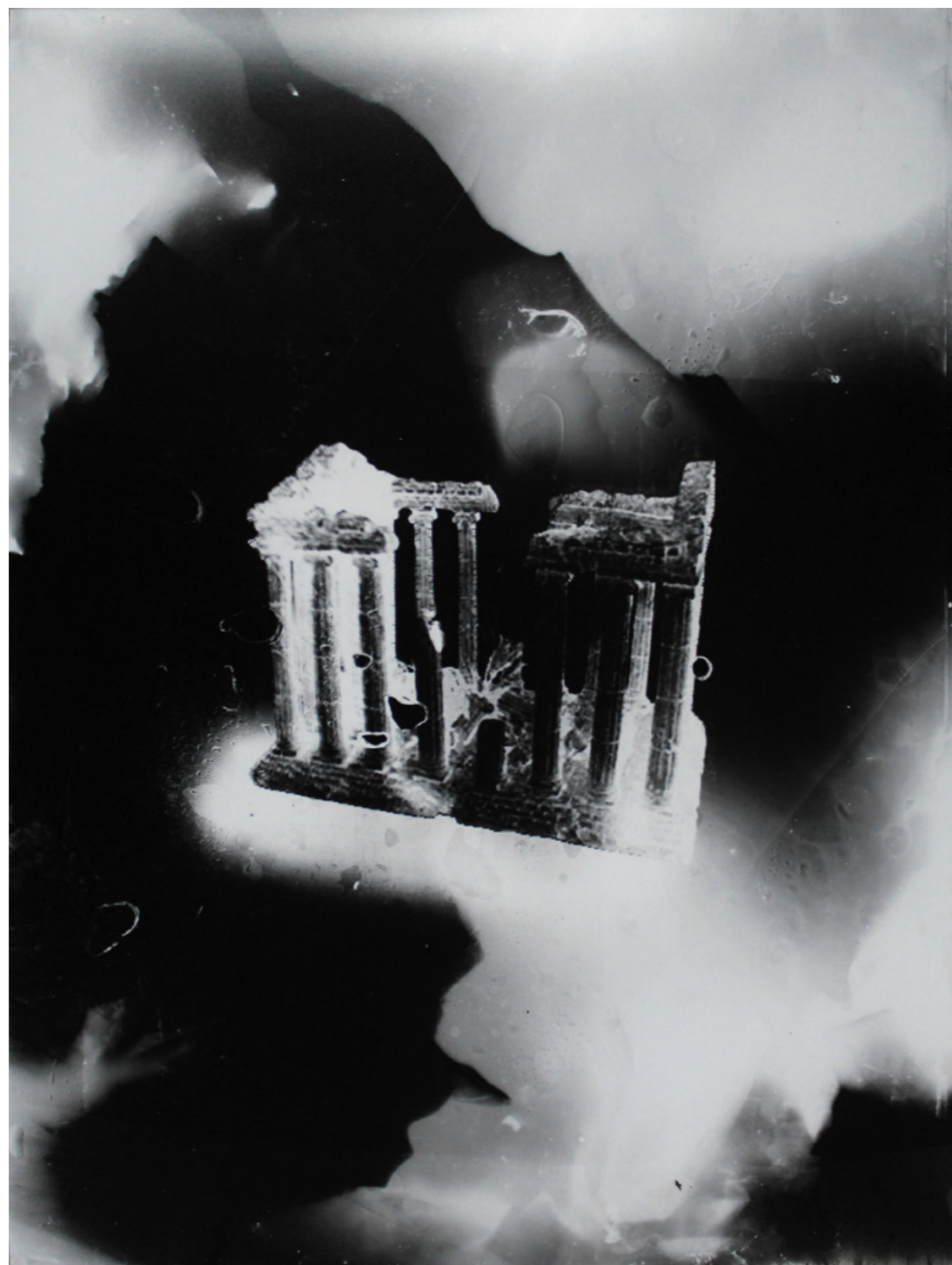
Guénaëlle de Carbonnières, série Submergées (ruines d'aquarium), 2020-22