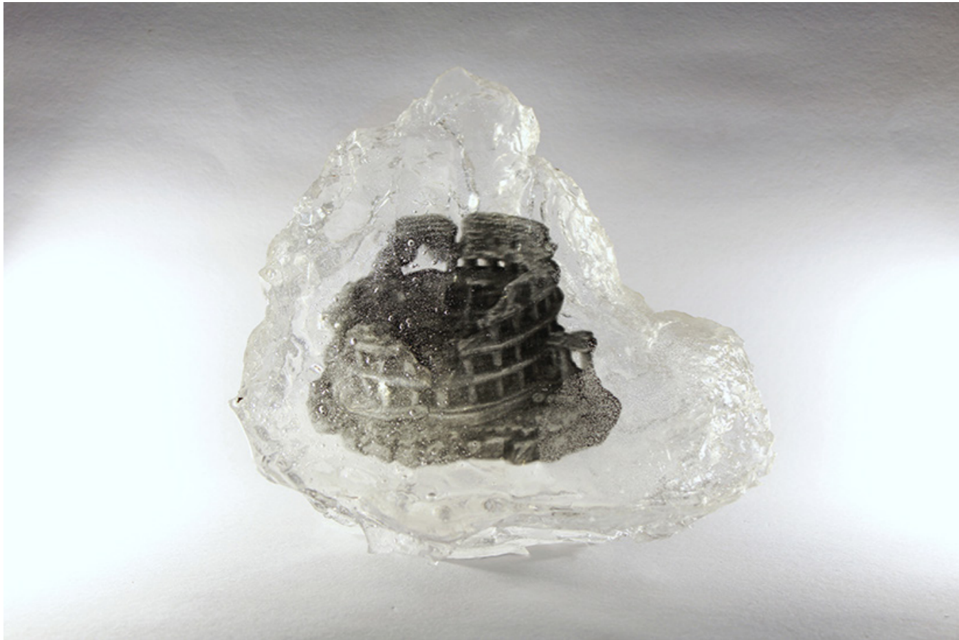
Guénaëlle de Carbonnières, série Captures fossiles, 2020-22 Colisée résine époxy et négatif photographique pièce unique dans une édition de 3 - 14 x 14 x 9 cm