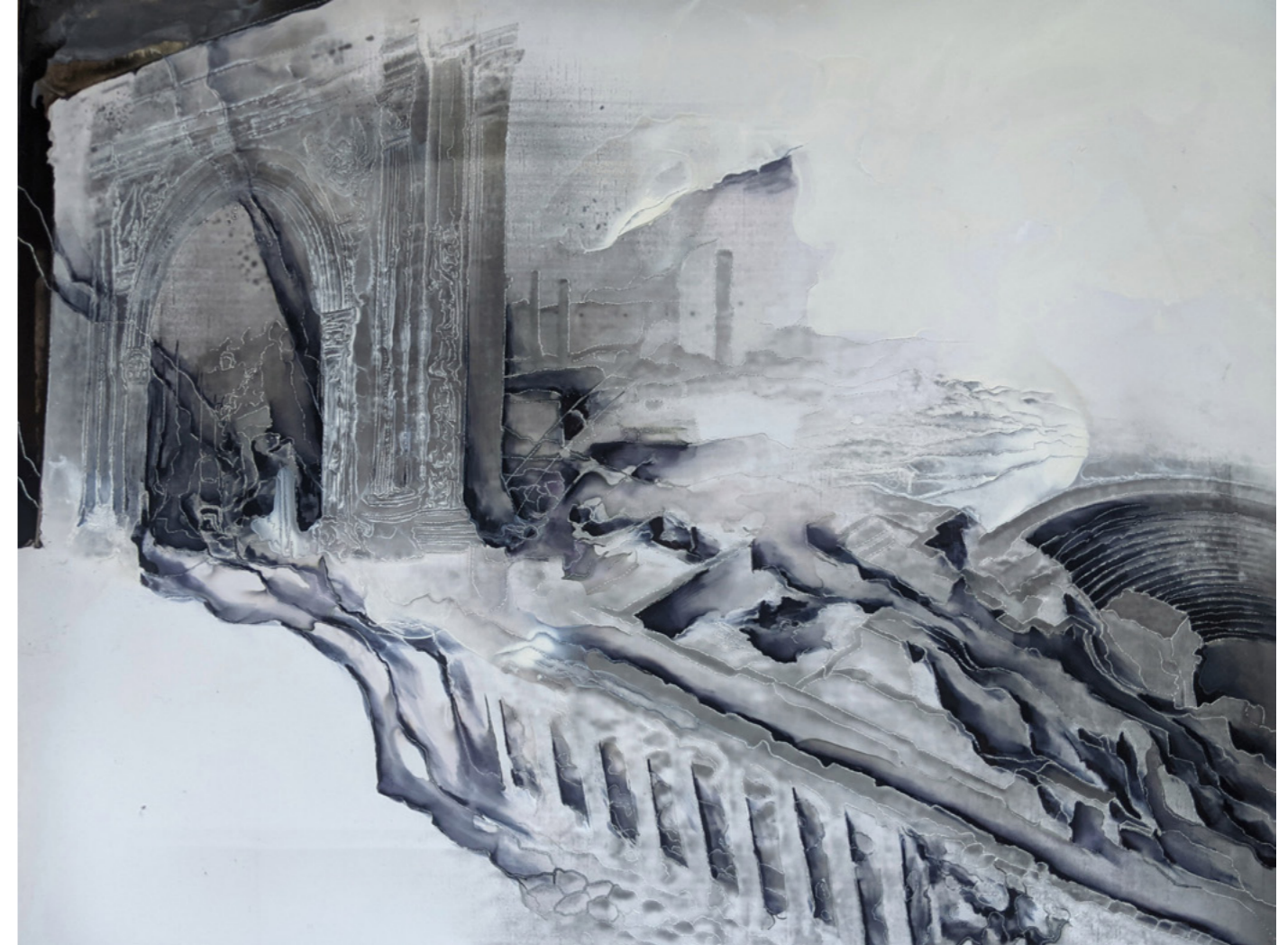
Guénaëlle de Carbonnières, série Creuser l'image, 2020-22