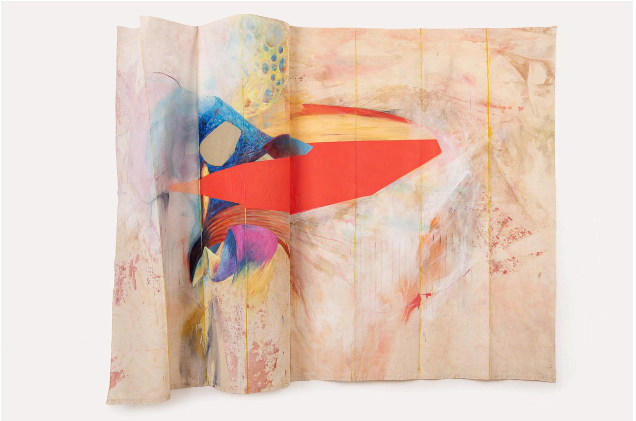
Sans titre , 2022, Tech.mixte, 130 X 270 cm ©Maud veith