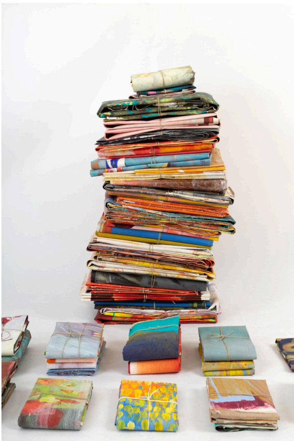
le poids de la peinture , installation in situ ©Maud veith