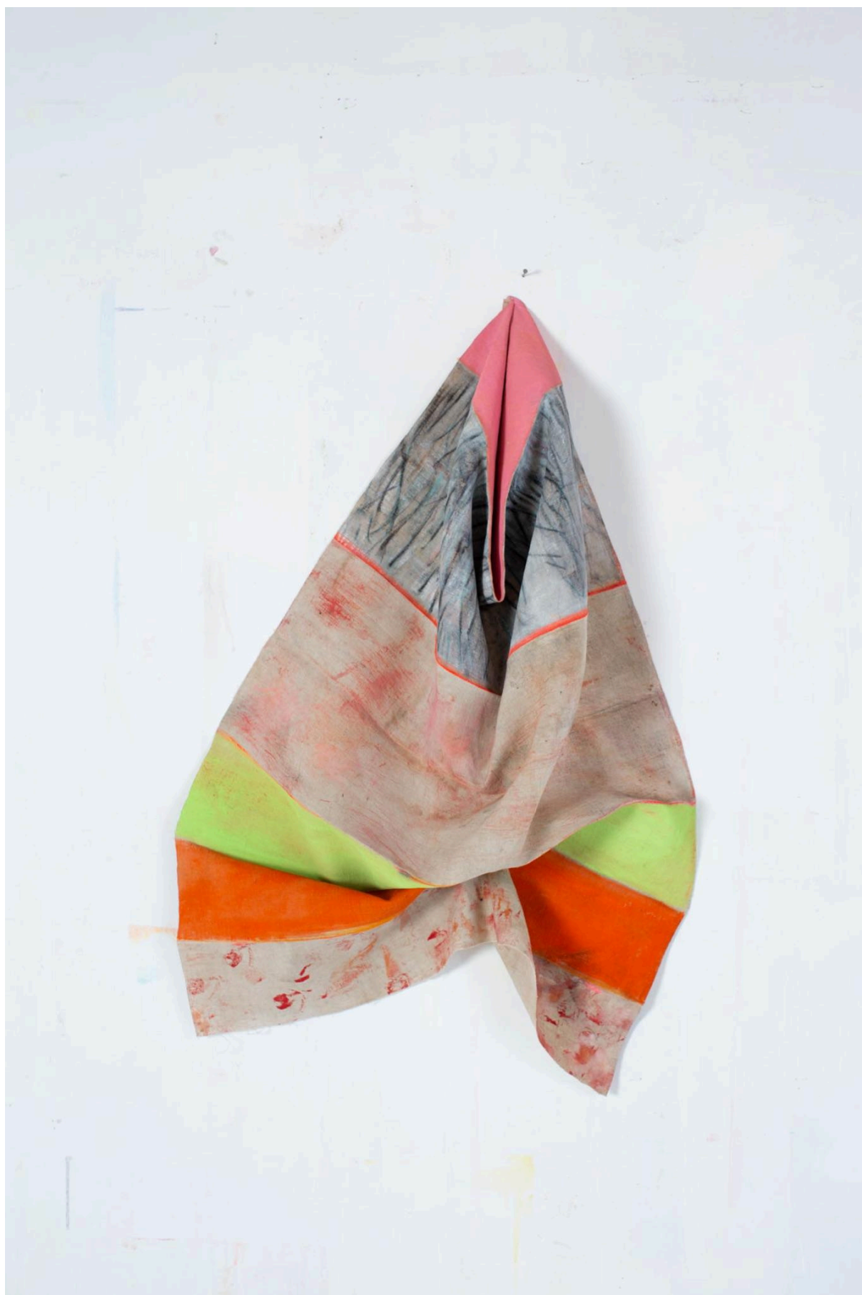
Sans titre , 2023, Tech.mixte, 84 X 57 cm ©Maud veith