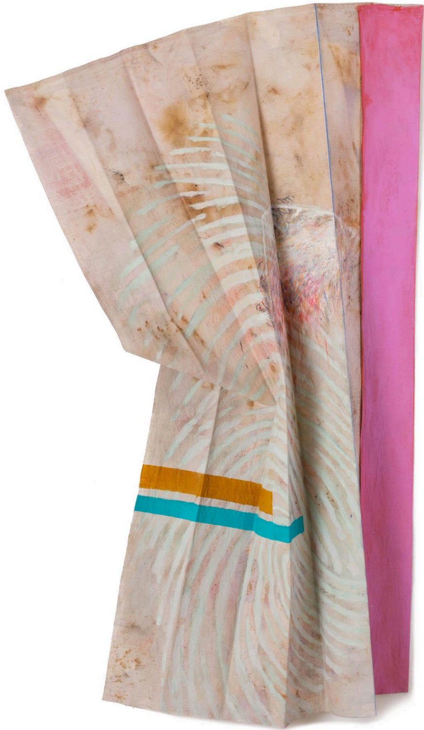
Sans titre , 2022, Tech.mixte, 149 X 75 cm ©Maud veith