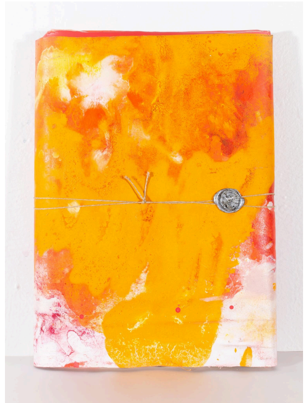
peinture emballée, 29/21 cm recto et verso