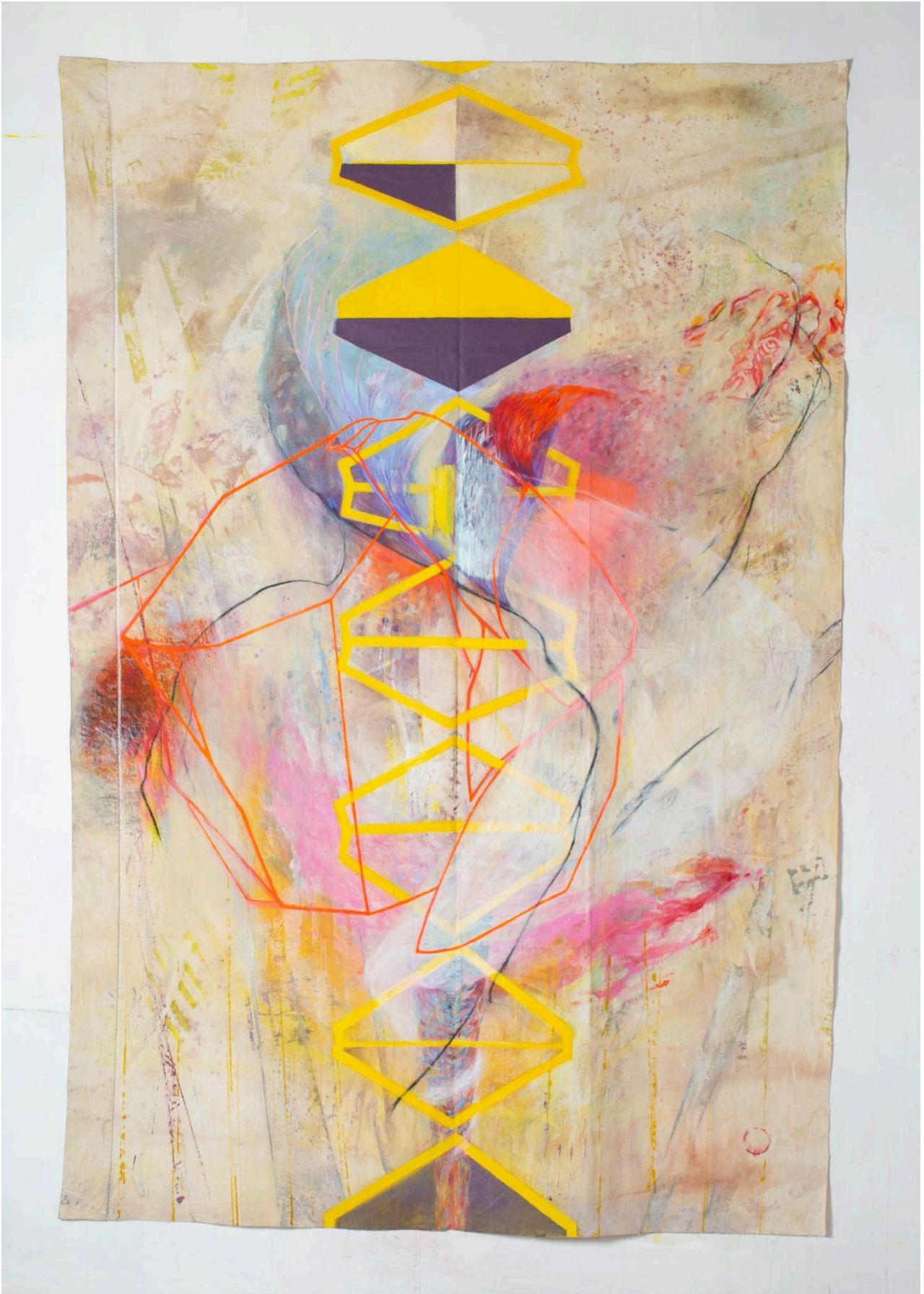
Sans titre , 2023, Tech.mixte, 236 X 154 cm ©Maud veith