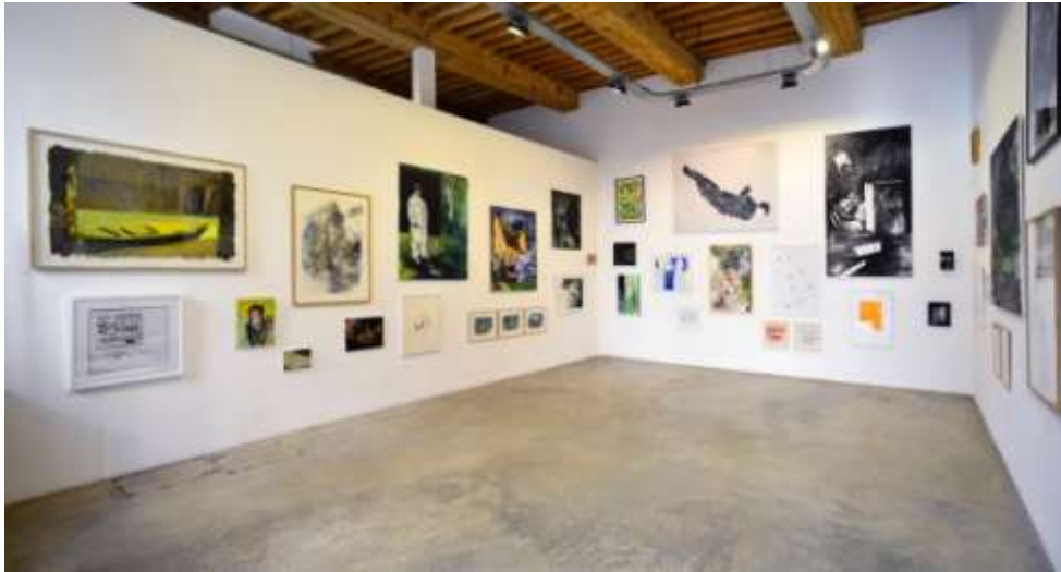
Vue de l'exposition L'œil & le cœur - volet 1 , février 2019, galerie Françoise Besson.

Active depuis 2004 à Lyon et sur la scène française et internationale, la galerie Françoise Besson défend et promeut des artistes émergents et confirmés. Particulièrement attachée à défendre la peinture et le dessin sans toutefois s'exclure à d'autres pratiques plastiques contemporaines (sculpture, photographie, vidéo, installations), la galerie organise 6 à 7 expositions personnelles et collectives par an. Chaque année à l'occasion des expositions, la galerie édite un Cahier de Crimée .