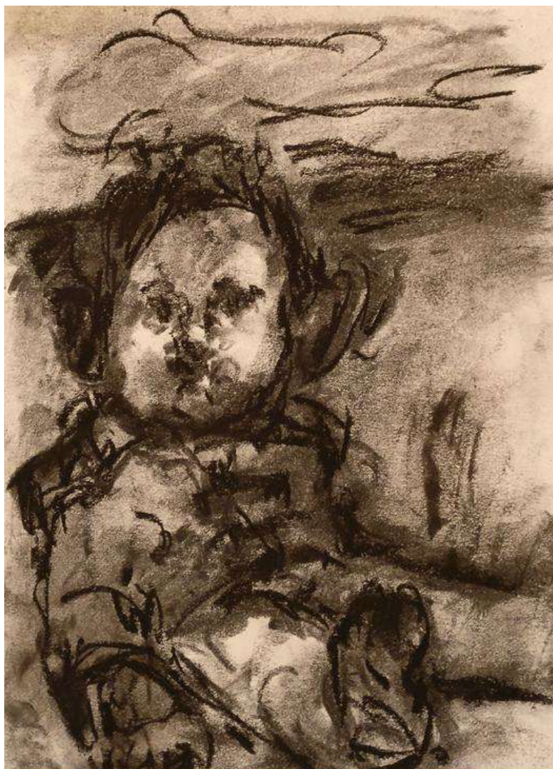
Little bouddha, 2020, fusain sur papier, 50 x 60 cm