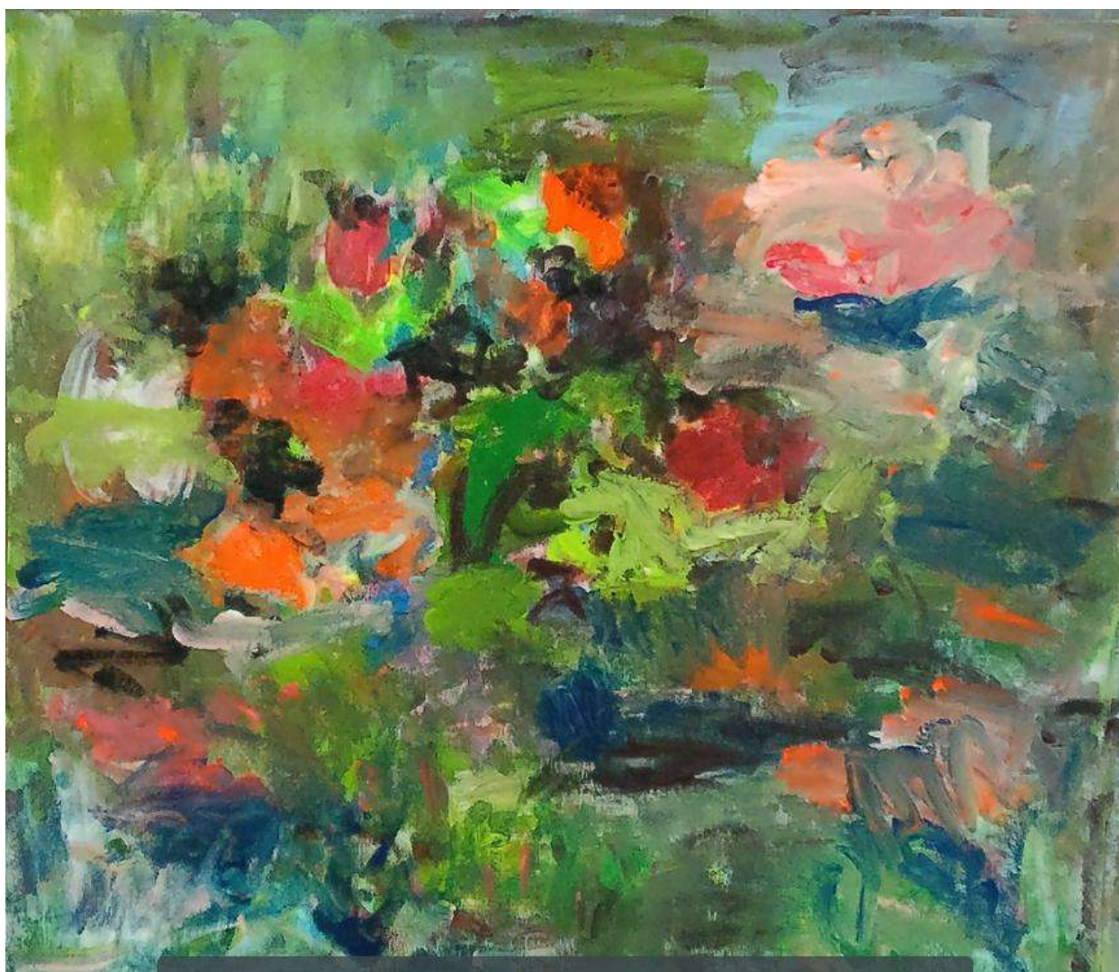
Nymphéas, 2020, acrylique sur toile, 80 x 80 cm