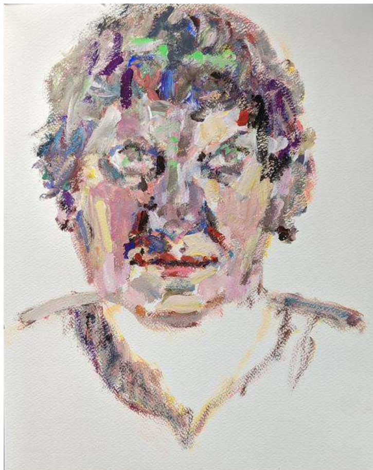
Bella, 2020, gouache sur papier, 42 x 29.7 cm