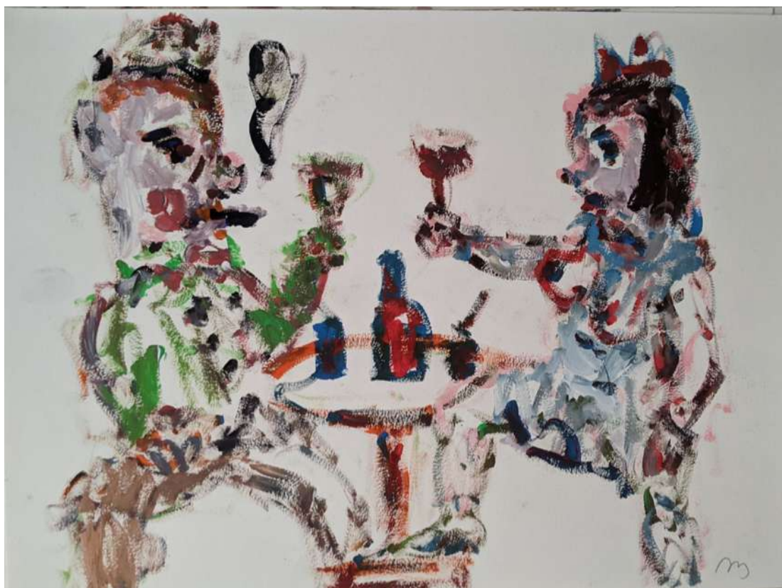
débauche, 2020, gouache sur papier, 42 x 29.7 cm